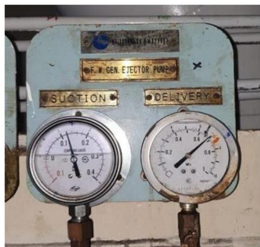
Gambar 4 Tekanan Normal Pompa Ejector