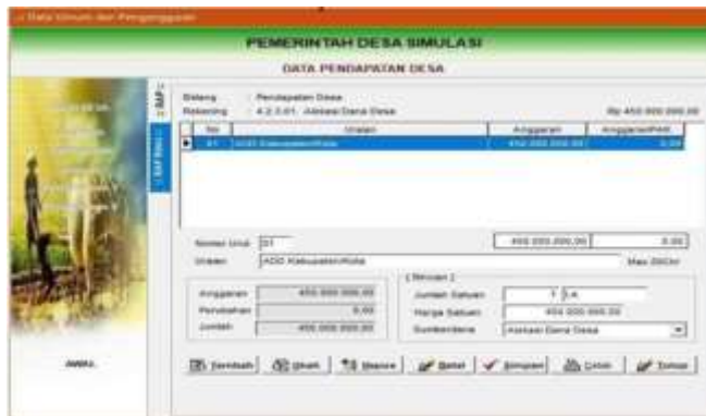
Gambar 4.6 Menu pencatatan RAP

7. Input data anggaran belanja pemerintah desa.