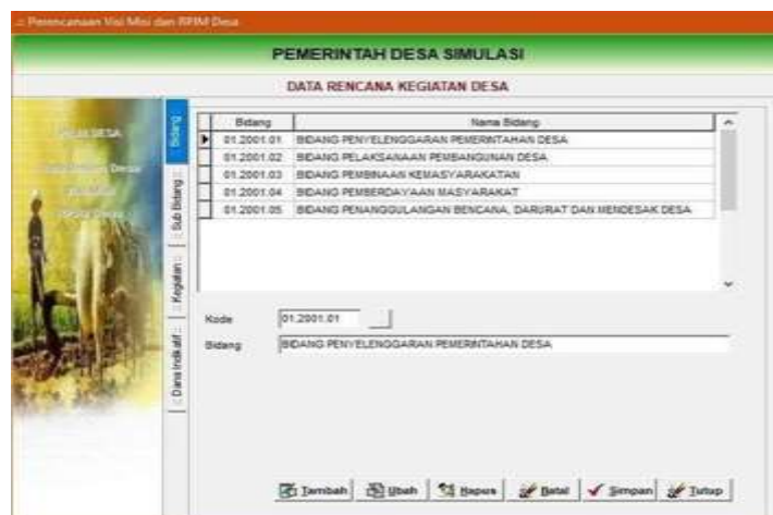
Gambar 4.1 Menu pengisian RPJM Desa