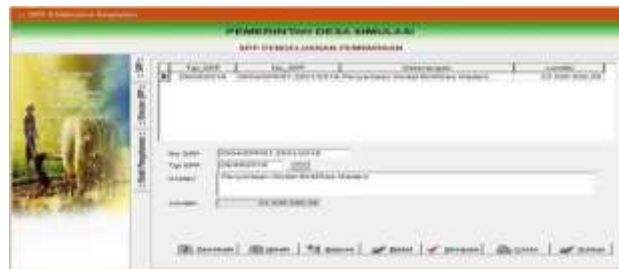
Gambar 4.17 Menu Pencatatan SPP Pembiayaan