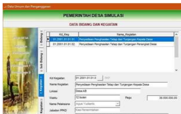
Gambar 4.4 Menu Pencatatan Kegiatan