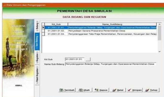
Gambar 4.3 Menu pengisian Sub Bidang