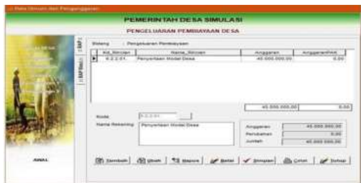
Gambar 4.10 Menu pencatatan pengeluaran pembiayaan