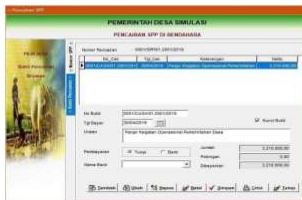
Gambar 4.18 Menu Pencatatan Pencairan SPP