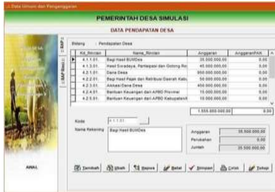
Gambar 4.5 Menu data Pendapatan

5. Lakukan penginputan data sub kegiatan