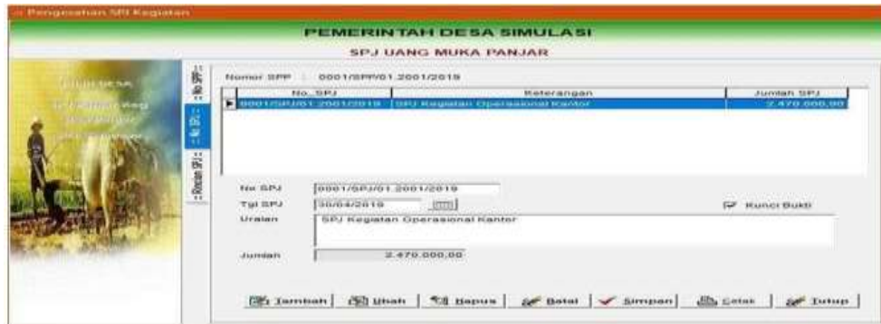
Gambar 4.20 Menu SPJ Uang Muka Panjar untuk mengisi keterangan

Double klik pada SPP Panjar yang akan di SPJ sehingga berpindah di nomor SPJ seperti berikut