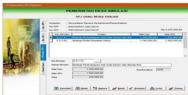
Gambar 4.21 Menu SPJ per rekening belanja

Klik tambah untuk mmmulai input data. Kemudian isi nomor, tanggal dan uraian SPJ. Lakukan double klik untuk menginput SPJ per rekening sehingga muncul seperti berikut: