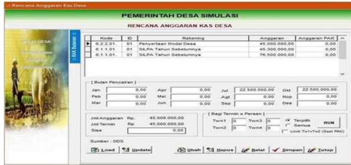
Gambar 4.14 Menu Rencana Anggaran Kegiatan

Setelah itu akan tampil Rencana Anggaran – Pembiayaan