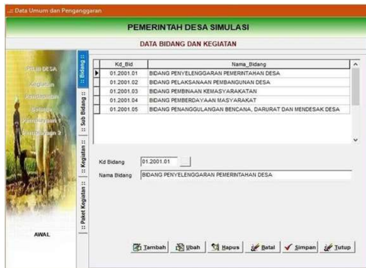
Gambar 4.2 Menu pengisian bidang