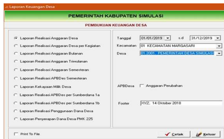
Gambar 4.35 Menu Laporan Pembukuan

Laporan pembukuan digunakan untuk mencetak laporan keuangan pemerintah desa. Untuk mencetak laporan pembukuan klik menu Laporan Pembukuan sehingga tampak sebagai berikut: