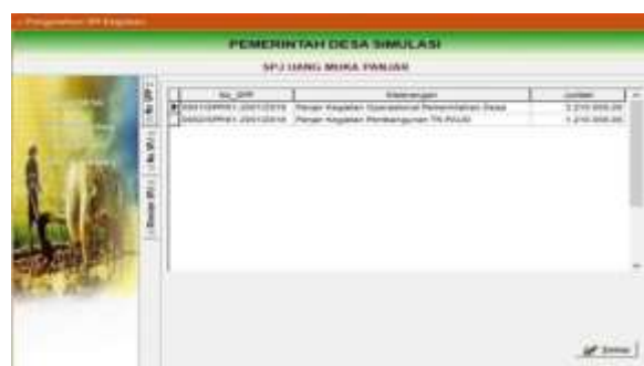
Gambar 4.19 Menu SPJ Panjar sebelum di SPJ

Terdapat 2 jenis dalam SPP yaitu, Pertama SPP Definitif ketika disetujui dan dicairkan maka proses pertanggungjawabam sudah selesai. Kedua, SPP Panjar yaitu dikarenakan uang muka, maka SPJ harus disampaikan ketika pencairan dana.