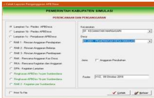
Gambar 4.15 Menu Laporan Penganggaran

10. Laporan Penganggaran, digunakan untuk mencetak output proses penganggaran