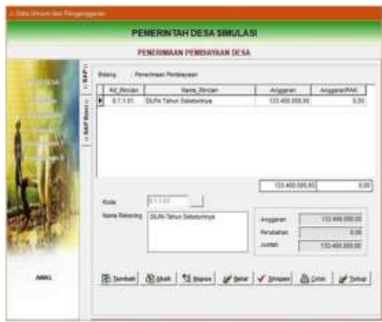
Gambar 4.9 Menu pencatatan RAP