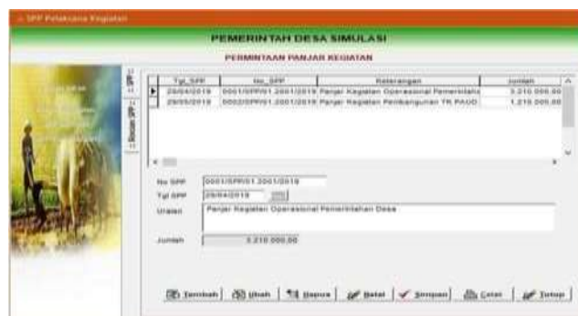
Gambar 4.16 Menu Pencatatan SPP Panjar