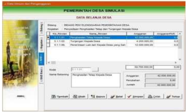
Gambar 4.8 Menu pencatatan RAB