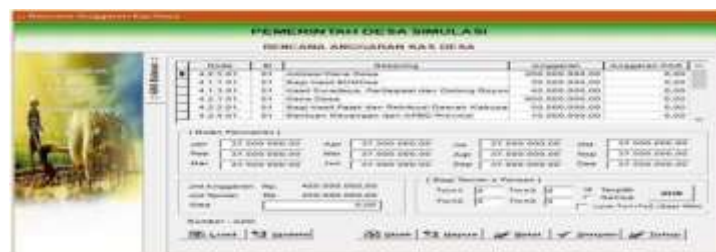
Gambar 4.12 Menu Rencana Anggaran Kas Desa

Pada anggaran kas desa berisi data Rencana Anggaran Kas Desa. Rencana anggaran kas desa merupakan arsip arus kas masuk dan keluar untuk menarik dana dari rekening kas untuk mendanai pengeluaran berdasarkan yang disahkan oleh kepala desa.