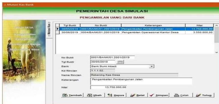
Gambar 4.28 Menu Pencayayan Pengambilan Uang Dari Bank

Mutasi kas digunakan untuk mencatat saldo kas desa. Dalam menu mutasi kas terdiri dari Menu Pengambilan dan Menu Penyetoran.