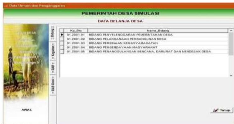
Gambar 4.7 Menu Pencatatan Bidang dalam Anggaran

7. Input data anggaran belanja pemerintah desa.