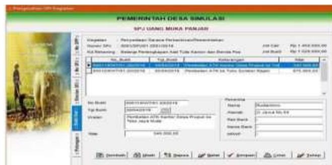
Gambar 4.21 Menu Pencatatan Bukti Kuitansi

Klik tambah sehingga muncul rekening belanja pada panjar sebelumnya. Double klik pada rekening yang akan di SPJkan sehingga muncul menu SPJ Uang muka panjar