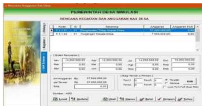
Gambar 4.13 Menu Rencana Anggaran Belanja

Sehingga akan tampil Rencana Anggaran – Belanja