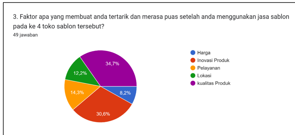
Gambar 2. Diagram Tanggapan Responden

setelah menggunakan jasa sablon tersebut. Adapun Faktor yang menjadi alasan responden dapat di lihat pada diagram berikut.