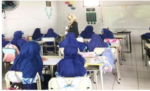
Gambar 3. Pertemuan Siklus II

Selama semester pertama kursus bahasa Inggris, terdapat peningkatan nyata pada kinerja siswa secara keseluruhan. Kondisi peserta didik dipertimbangkan sebelum tindakan diambil. Sepuluh siswa atau 52 persen hadir pada awal proses pembelajaran. Siswa-siswa ini pada akhirnya akan menjadi empat belas siswa, atau 64%.