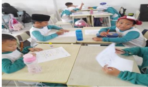
Gambar 2. Siswa Berdiskusi Dengan Kelompok Siklus I