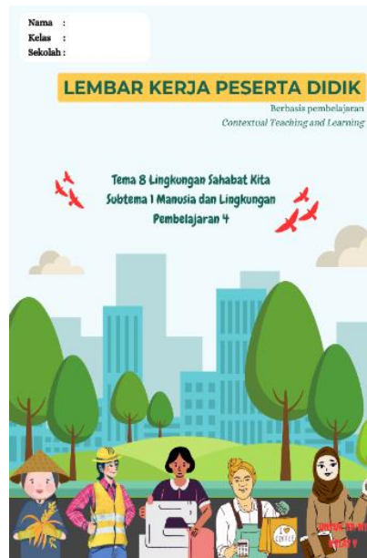
Gambar 1 Sampul Depan

Pada tahap development , peneliti mengembangkan produk berdasarkan prototipe produk dan produk divalidasi oleh validator sampai menghasilkan produk yang valid. Berikut hasil pengembangan dan hasil validasi produk.