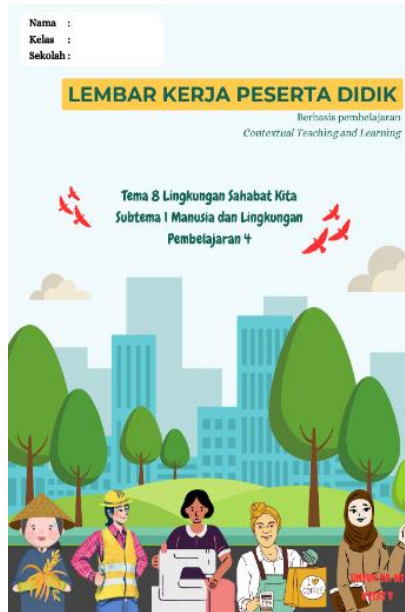
Gambar 2 Sampul Depan

Berdasarkan hasil validasi aspek desain dapat dilihat pada tabel 3 dengan skor rata-rata 95,8% dengan kriteria "sangat valid". Setelah dilakukan pengembangan, produk akhir lembar kerja peserta didik berbasis pembelajaran contextual teaching and learning adalah sebagai berikut.