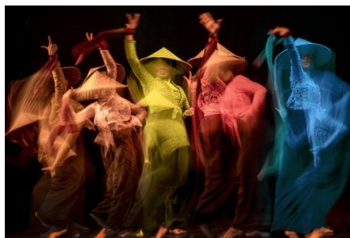
Gambar 1. Tari dalam Slow Motion