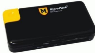
Gambar 6 Card Reader Micropack

Pembaca kartu penyimpanan berfungsi sebagai alat untuk memindahkan foto digital dari kartu penyimpanan ke komputer. Card reader yang digunakan adalah merk Micropack , card reader ini mampu mengirim data dengan cepat dan stabil.