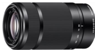
Gambar 2 Sony 55-210mm F.4.5-6.3

Lensa yang digunakan oleh pencipta adalah lensa Nikkor 18-200 mm f 3,5-5,6 yang digunakan untuk mengambil sudut luas dan sudut sempit dari objek foto dan lensa Nikkor 35mm f 2,8 digunakan untuk mengambil depth of field (dof) sempit.