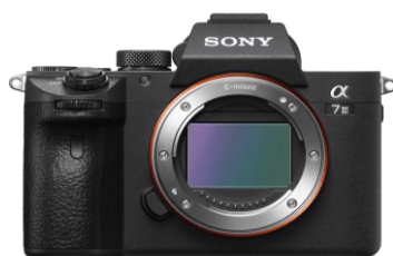
Gambar 1 Kamera Sony a7 mark iii

Kamera yang pencipta gunakan adalah kamera digital SLR merk Nikon seri D7000. Kamera ini sudah cukup untuk memenuhi kebutuhan pencipta dalam mewujudkan sebuah karya kritik sosial materialis. Kamera ini memiliki kelebihan jumlah pixel sebesar 16 megapixel dan mampu merekam gambar video dengan format high definition (HD) 1080.