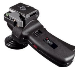
Gambar 5 Head Tripod merk Manfrotto