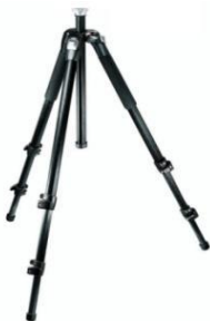
Gambar 4 Tripod merk Manfrotto

Tripod kamera merupakan alat yang penting bagi seorang fotografer dalam menghasilkan gambar yang tajam dan stabil. Dalam penggunaannya, perlu diperhatikan jenis dan kualitas dari tripod kamera yang dipilih agar dapat menunjang kinerja fotografer dalam mengambil gambar. Tripod kamera terdiri dari beberapa bagian yang harus diperhatikan, seperti kaki tripod, kepala tripod, dan sistem pengunci. Selain itu, juga perlu diperhatikan faktor-faktor seperti kestabilan, kekuatan, dan fleksibilitas dari tripod kamera dalam menunjang kebutuhan fotografer." (Suryana, D. (2021). Tripod yang digunakan adalah tripod merk Fancier yang digunakan untuk memegang flash dikarenakan tripod tersebut terbuat dari besi dan ukurannya kecil dan tripod merk Manfrotto digunakan untuk memegang kamera dikarenakan tripod tersebut memiliki ukuran yang besar, berat dan stabil.