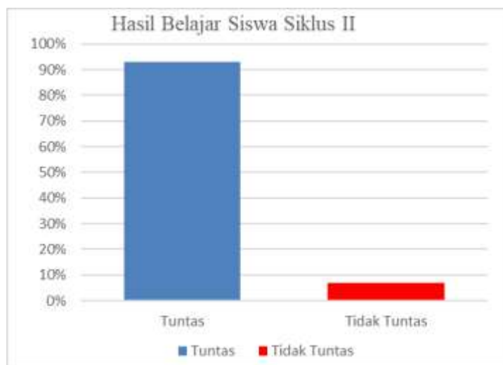
Gambar 6 Diagram Hasil Belajar Siswa Siklus II

Dari penjelasan diatas dapat disimpulkan bahwa hasil belajar siswa pada pembelajaran Bahasa Indonesia dikelas II dengan media gambar sudah memenuhi dari indikator keberhasilan yaitu 75% dan dapat dikatakan penelitian berhasil.