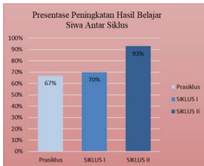
Gambar 7 Diagram Persentase Peningkatan Hasil Belajar Siswa Antar Siklus

Pra Siklus sebesar 67%, lalu meningkat pada Siklus I 70%, dan meningkat lagi pada Siklus II sebesar 93%. Dengan data hasil belajar yang meningkat maka dapat dikatan indikator keberhasilan yang di capai dalam penelitian ini dapat dikatakan berhasil pada saat siklus II.