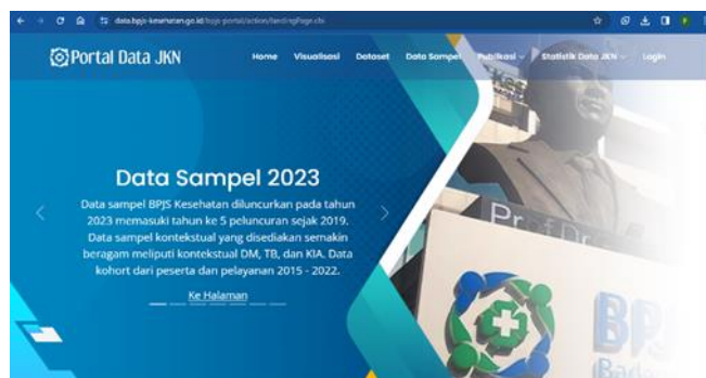
Gambar. 1 Portal data JKN

Dalam menjalankan upaya kami menjamin keamanan hukum layanan elektronik sesuai dengan peraturan perundang-undangan, khususnya Peraturan Presiden Republik Indonesia Nomor 95 Tahun 2018 tentang Sistem e-Government. Berkomitmen untuk memberikan pelayanan kesehatan yang efektif dan efisien melalui transformasi digital, Kementerian Kesehatan (Kemenkes) RI telah menerbitkan Keputusan Menteri Kesehatan (KMK) No.HK.01.07/MENKES/1559/2022 tentang Penyelenggaraan E-Government. Sistem layanan kesehatan dan strategi transformasi digital layanan kesehatan. Selain itu, pengembangan sistem jaminan kesehatan dilakukan pada website Portal Data JKN yaitu link website berikut: https://data.bpjs-kesehatan.go.id/bpjs-portal/action/landingPage.cbi