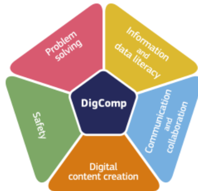
Gambar 1. DigComp 2.2: The Digital Competence Framework for Citizens (2022).

and data literacy (literasi informasi dan data), communication and collaboration (komunikasi dan kolaborasi), digital content creation (penciptaan konten digital), safety (keamanan), dan problem - solving (pemecahan masalah). (VUORIKARI Rina et al., 2022). Framework ini akan diterapkan untuk konseptualisasi AI prompt engineering.