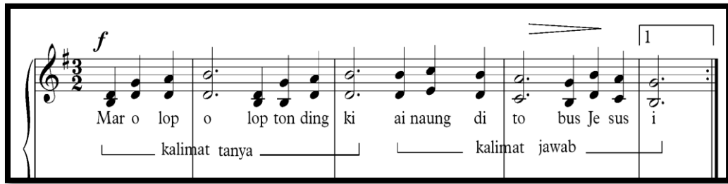
Gambar 1 Bagian A lagu Marolopolop Tondingki (Rewrite : Penulis)

birama ke-2 dalam ketukan pertama. Keterangan selanjutnya dapat dilihat pada gambar dibawah ini.