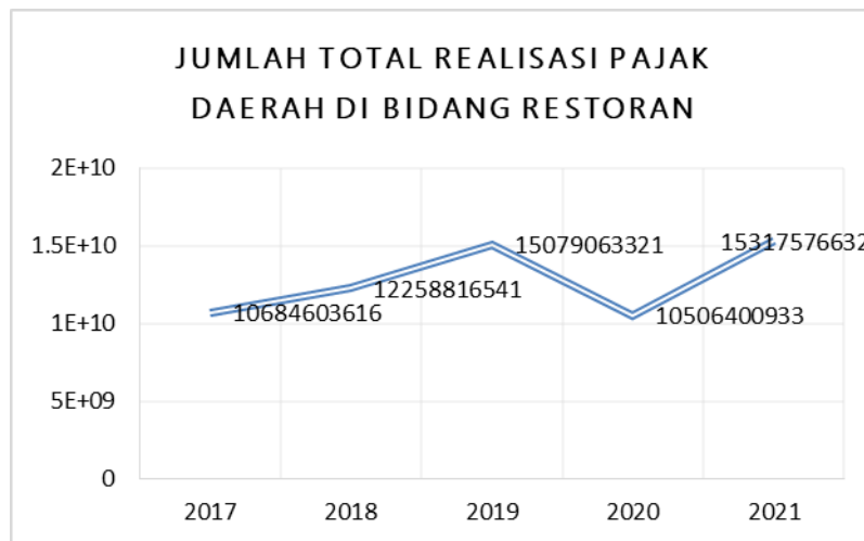
Gambar 1. Jumlah Total Realisasi Pajak Daerah di Bidang Restoran

Atas hal itu, temuan penelitian menunjukkan dampak adanya penerapan sistem pembayaran pajak online turut memberikan implikasi terhadap realisasi pajak tahunan yang di targetkan. Di sektor restoran angka realisasi pajak daerah menunjukkan peningkatan yang dapat dilihat pada diagram berikut: