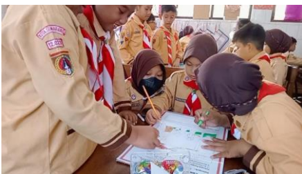
Gambar 1. Proyek Poster Pada Pertemuan II