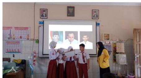
Gambar 2. Proyek Puzzle Pada Pertemuan I