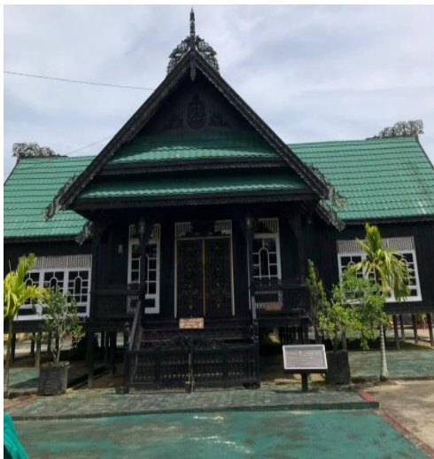
Gambar 2. Rumah Adat Baloy

Pada pertemuan Modul Nusantara berikutnya mahasiswa diberi kesempatan mengunjungi Rumah Adat Suku Tidung. Rumah Adat Suku Tidung berbentuk seperti rumah panggung. Di bagian dinding luar, dinding dalam dan juga tiang dihiasi dengan ukiran bermotif kehidupan laut. Rumah Baloy juga memiliki ruangan khusus sebagai tempat musyawarah untuk menyelesaikan masalah. Yang membuat rumah adat ini unik adalah pintu utamanya selalu menghadap ke Selatan dan bangunan ini menghadap ke Utara.