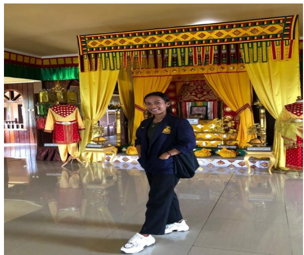
Gambar 3. Kunjungan Rumah Adat Baloy