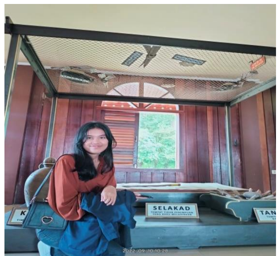
Gambar 5. Kunjungan Rumah Adat Baloy