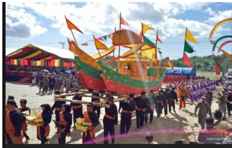
Gambar 1. Perayaan Iraw Tengkeyu

perahu dihanyutkan kelautan, beberapa upacara tersebut diiringi dengan berbagai tarian adat Suku Tidung, Parade musik, Lomba Sumpit, lari maraton 10 Km, Lomba makan laut dan masih banyak lagi. Menurut data yang mahasiswa terima dari salah satu Tokoh Adat, Upacara menghanyutkan Perahu ini dimulai di jam 3 sore. Dan Perahu tersebut akan diangkut oleh 3 Pemuda menggunakan beberapa bilah bambu. Perahu tersebut juga dihiasi oleh 3 warna cat yaitu Kuning, Hijau dan Merah. Menurut informasi yang didapat oleh mahasiswa dari tokoh adat bagian atas perahu diberi warna kuning sebagai lambang kehormatan, warna merah sebagai lambang ketegasan, dan warna hijau sebagai lambang untuk para pendatang yang dihormati. Upacara Iraw Tengkeyu diadakan setiap 2 kali dalam setahun.