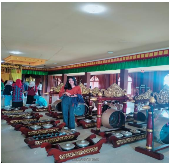
Gambar 4. Kunjungan Rumah Adat Baloy