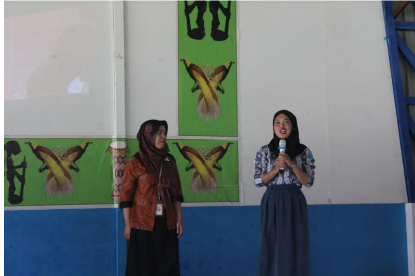
Gambar 3. Pelaksanaan Kegiatan Pengabdian Kepada Masyarakat