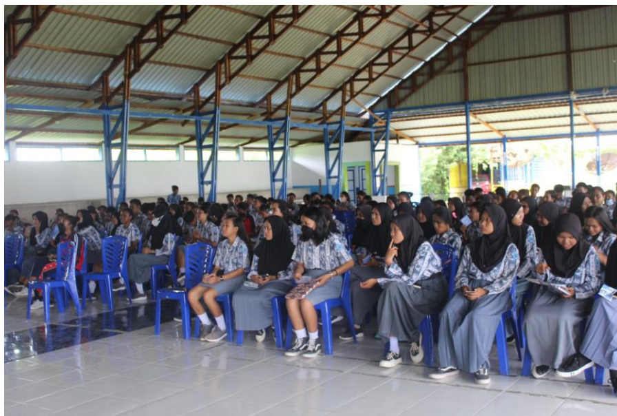
Gambar 2. Pra Pelaksanaan Kegiatan Pengabdian Kepada Masyarakat

Pelaksanaan pengabdian masyarakat diawali dengan pendataan siswi SMA Negeri 3 Nabire kelas XII dan dilanjutkan dengan pendataan siswi yang masuk dan tidak masuk karena anemia. Dalam rangka meningkatkan pengetahuan remaja putri mengenai anemia, mula-mula diberikan edukasi tentang definisi anemia, pencegahan dan penanganan. Remaja putri dengan anemia juga dapat mengalami penurunan prestasi akademik, penurunan daya tahan tubuh yang membuat mereka lebih rentan terhadap penyakit infeksi, penurunan tingkat kebugaran sehingga menurunkan juga produktivitas dan prestasi olahraga, bahkan ketidakmampuan untuk mencapai tinggi badan maksimal karena ada puncak pertumbuhan tinggi badan selama periode ini. Anemia pada remaja putri disebabkan oleh beberapa faktor yaitu kurangnya pengetahuan, sikap, serta kemampuan remaja karena kurangnya informasi yang diberikan, kurangnya perhatian dari orang tua, masyarakat, dan pemerintah terhadap kesehatan remaja, serta pelayanan kesehatan yang belum optimal. Indikator keberhasilan penyuluhan anemia berdasarkan, pengetahuan remaja putri mengenai anemia, pencegahan anemia, dan aktivitas belajar.