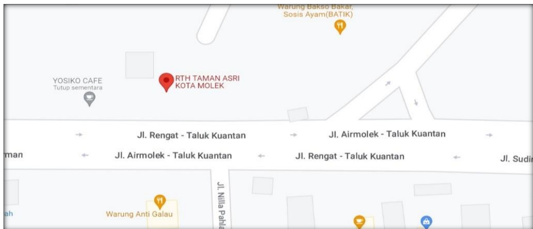
Gambar 2. Lokasi Penelitian

Lokasi penelitian dilakukan pada Ruas Jalan Sudiman dekat RTH Airmolek Indragiri Hulu Riau. Berikut peta lokasi penelitian terdapat pada gambar 2 berikut ini.