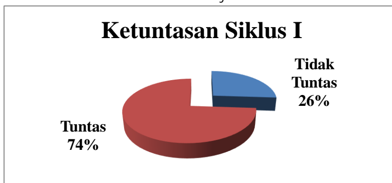
Grafik Hasil Belajar Siklus 1

Hasil belajar siswa siklus 1 tidak berhasil karena tidak mencapai KKM yang telah ditetapkan sekolah 75% ketuntasan secara individu dan klasikal. Hal ini terjadi karena beberapa hal diantaranya: 1) Guru dalam menyampaikan tujuan pembelajaran kurang jelas, 2) guru hanya menggunakan media Handphone dengan daya Internet namun hanya menguasai google sebagai sarana membaca, 3) Pemakaian waktu yang belum optimal.