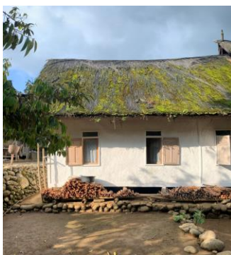
Gambar 1. Rumah adat kampung naga

Salah satu ilustrasi yang dapat disampaikan bahwa apabila wisatawan berkunjung di Kampung Naga akan disambut dengan penuh keramahan oleh penduduknya dengan cara dan tatalaku aturan adat istiadat tradisi mereka. hal ini menunjukkan betapa pentingnya nilai-nilai dari leluhur mereka yang hingga saat itu terus dijaga dan dirawat meskipun kehidupan era sekarang ini sudah maju dengan berbagai teknologi yang sudah menjamah dihidupan masyarakat-masyarakat kecil namun berbeda dengan masyarakat kampung naga kemajuan itu dan teknologi tersebut tidak digunakan oleh masyarakatnya. Seperti gambar di bawah ini.