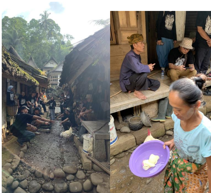
Gambar 2. Rumah adat kampung naga

Bukan tanpa sadar masyarakat Kampung Naga dalam mempertahankan nilai-nilai dari leluhur mereka hal ini tentunya tidak terlepas dengan ritual bahkan keharusan bagi masyarakat untuk menjalankannya (Karim, 2022 hal.17) keharusan yang dilakukan misalnya kejujuran, sopan santun bahkan saling tolong menolong kepada orang lain. Hal ini yang berhubungan dengan nilai-nilai kelokalan yang dapat disajikan pada pengunjung wisatawan bahwa kehidupan masyarakat Kampung Naga memiliki tatalaku adat baik untuk ditiru pada masyarakat global. Salah satu ilustrasi yang dapat dicontohkan dalam penelitian ini ialah disaat wisatawan berkunjung di Kampung Naga mereka merasakan kehangatan saat berbaur dengan warga Kampung Naga dengan segala kesopan santunannya yang dapat diamati oleh pengunjung. Ilustrasi tersebut dapat dilihat pada contoh gambar di bawah ini.