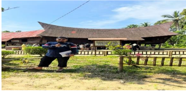
Gambar 3. Foto Penelitian Kuok Kabupaten Kampar

Metode pengumpulan data pada penelitian ini adalah dengan cara observasi dalam sebuah pengamatan serta menganalisa. Sebelum penelitian ini dilakukan peneliti menentukan masalah terlebih dahulu, yaitu dengan cara mendengarkan informasi dari narasumber dan menetapkan masalah yang akan diambil.