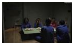
Gambar 27. Anggota sel 10 tidak nafsu makan dan sibuk dengan pikiran masing-masing

Representasi kekeluargaan yang disimbolkan pada gambar 26, durasi 01.49.17 setelah anggota sel 10 kembali usai bekerja, mereka terkejut mendapati Yunyoung yang tergeletak di lantai dengan ketuban yang pecah. Keadaannya mengkhawatirkan, tubuhnya melemas dengan keringat dingin yang bercucuran. Mereka panik hingga tidak tahu harus berbuat apa. representasi kekeluargaan dalam gambar 27 akan memberikan gambaran jauh lebih kompleks.