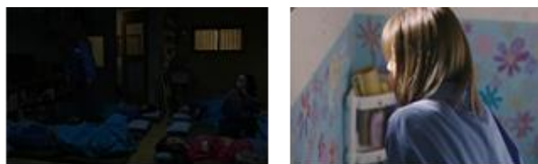
Gambar 23. Anggota sel 10 mempersiapkan kejutan untuk

Pada gambar 22, durasi 01.26.49 nampak Yunyoung yang telah membuka diri dan berdamai dengan keadaan. Walau tidak sepenuhnya, namun usaha yang dilakukan anggota sel 10 telah membuahkan hasil. Kasih sayang yang dicurahkan untuk Kekeluargaan yang semakin intens Yunyoung dan sang bayi membuat Yunyoung bertahan hingga detik itu. Bincang hangat, pelukan hangat, dan suapan lembut untuk Yunyoung merupakan beberapa symbol realitas representasi kekeluargaan yang terbentuk di penjara antara dirinya dengan rekan satu selnya.