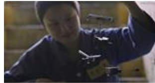
Gambar 25. Sarang membuat mainan dari besi bekas

Pada gambar 24, durasi 01.37.34 dan 01.40.32 — 01.41.31 ditunjukkan anggota sel 10 yang sedang menjahitkan pakaian untuk sang bayi dengan bahan-bahan seadanya. Representasi kekeluargaan ditunjukkan dalam adegan tersebut untuk menyambut kedatangan Yunyoung kecil.