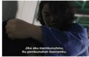
Gambar 17. Guru yang muncul ketika mengetahui Yunyoung diganggu oleh tahanan lain

Pada gambar 17, durasi 01.05.32 saat Haesoo dan Kakak menemani Yunyoung di tepi lapangan, datang tahanan lain yang mencoba mengganggu Yunyoung dan mengusir Haesoo dan Kakak. Saat itulah Guru datang dan memberi peringatan kepada tahanan yang mengganggu gadis satu selnya. Jelas ditunjukkan kepedulian dan kasih sayang Guru kepada rekan-rekannya. Bersikap lembut dan menjadi tameng untuk rekan selnya merupakan representasi kekeluargaan yang terjalin sesuai realita di masyarakat.