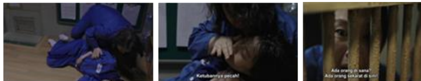
Gambar 26. Anggota sel 10 panik yang mendapati Yunyoung tergeletak di lantai

Pada gambar 25, durasi 01.45.47 diam-diam Sarang sedang membuat mainan untuk bayi Yunyoung. Nampak dari ekspresinya, Sarang begitu bahagia dengan hasil karyanya. Ekspresi yang di simbolkan oleh Sarang menunjukkan bahwa dirinya menyayangi Yunyoung dan bayinya. Representasi kekeluargaan jelas terekam dalam adegan tersebut. Walau dirinya sering berlaku kasar kepada Yunyoung, namun dirinya memperhatikan Yunyoung dan sang bayi.