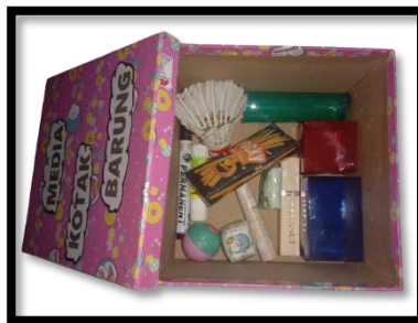
Gambar 2 : Bentuk Bangun Ruang