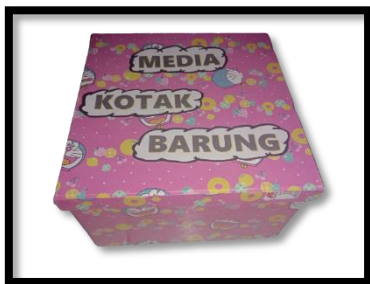
Gambar 1: Media Kotak Barung