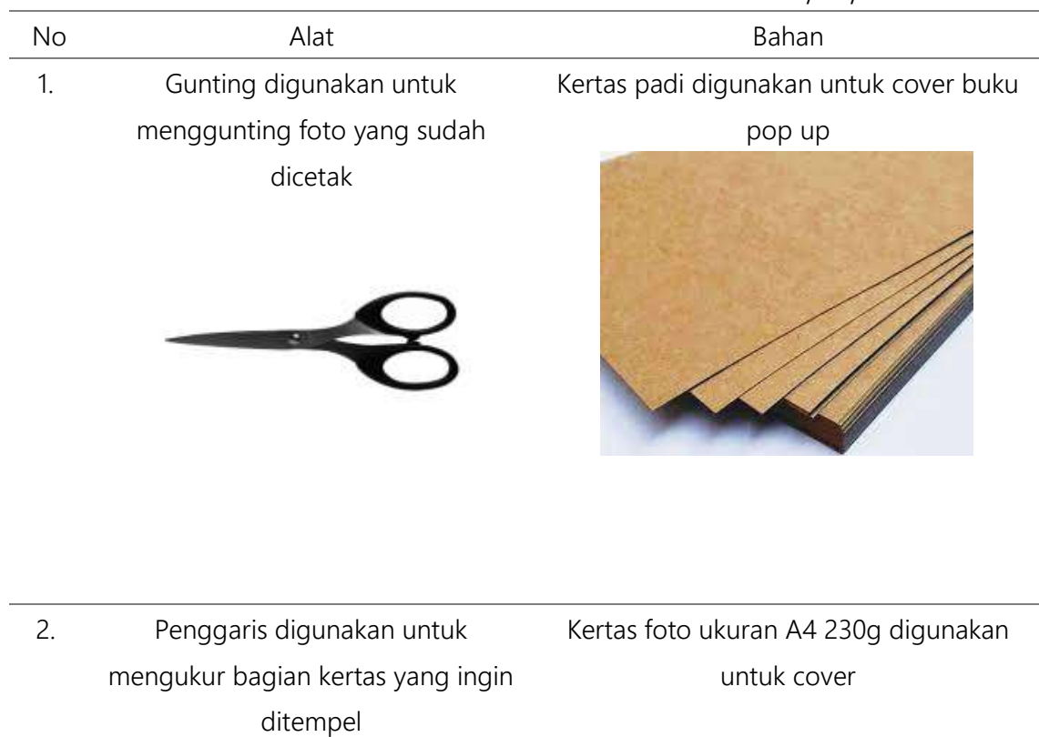
Tabel 4.1 Pemilihan Alat dan Bahan Media Buku Pop Up