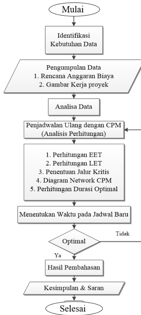
Gambar 1. Flowchart Penelitian