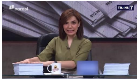
Gambar 1. Najwa Shihab Menunjukkan 2 Tumpukan Naskah yang Telah Diserahkan kepada Presiden dan yang Telah Disahkan di Paripurna.