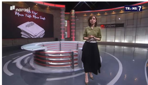
Gambar 2. Style Najwa Shihab pada Program Mata Najwa Episode “Cipta Kerja: Mana Fakta Mana Dusta”.

Dari pembuktian aspek ethos ini, Najwa Shihab juga memenuhi kriteria aspek tersebut. Ethos sendiri merujuk pada karakter, kecerdasan, dan persepsi dari seorang pembicara. Raut wajah yang ditunjukkan oleh Najwa Shihab terlihat serius dengan sesekali tersenyum dan menggerakkan tangannya, menandakan bahwa Najwa Shihab telah memahami serta menguasai topik diskusi pada program tersebut. Tak hanya itu, Najwa Shihab pada program ini menggunakan baju berwarna hijau army yang dipadukan dengan rok hitam dan menggunakan sepatu heels hijau army pula. Hal ini memberikan kesan santai dan menunjukkan karakter tegas melalui penampilannya.