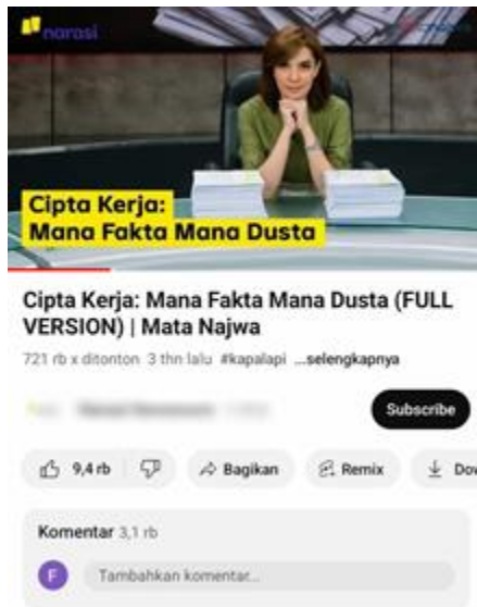
Gambar 4. Bukti Banyaknya Komentar pada Kolom Komentar Channel Youtube Narasi Episode “Cipta Kerja: Mana Fakta Mana Dusta”

kolom komentar di channel youtube narasi episode “Cipta Kerja: Mana Fakta Mana Dusta”.