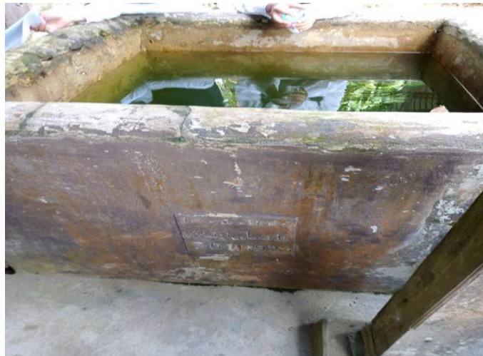
Gambar 5. Kula atau Penampungan Air di Rumah Lontik

Tangga, yang berada di sebelah kanan rumah adat Lontik, mengandung makna bahwa setiap individu akan mengalami perubahan ke arah yang lebih baik dari waktu ke waktu dalam hidupnya. Tangga melambangkan perjalanan menuju tingkat yang lebih tinggi atau menuju perbaikan (Karina, Faizah, Elmustian, & Syafril, 2022). Berikutnya adalah penampungan air atau Kula.