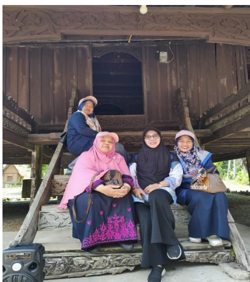
Gambar 9. Kunjungan ke Rumah Adat Lontioq

Tak kalah pentingnya, tangga rumah lontioq juga mencerminkan keindahan estetika lokal. Motif-motif dan ukiran pada setiap anak tangga menggambarkan kekayaan seni dan keterampilan kerajinan tangan tradisional. Keindahan ini bukan hanya sekadar aspek dekoratif, tetapi juga sebagai ekspresi nilai-nilai budaya yang diwariskan dari generasi ke generasi. Dengan memahami nilai-nilai yang terkandung dalam tangga rumah lontioq di Desa Pulau Belimbing, kita dapat meresapi dan menghargai lebih dalam kearifan lokal dan keunikan budaya yang tersimpan dalam struktur arsitektural ini (Redovan Jamil, 2023). Artikel ini akan menggali lebih dalam setiap aspek nilai-nilai tersebut, membawa kita pada perjalanan untuk lebih memahami dan menghargai kekayaan budaya Desa Pulau Belimbing.