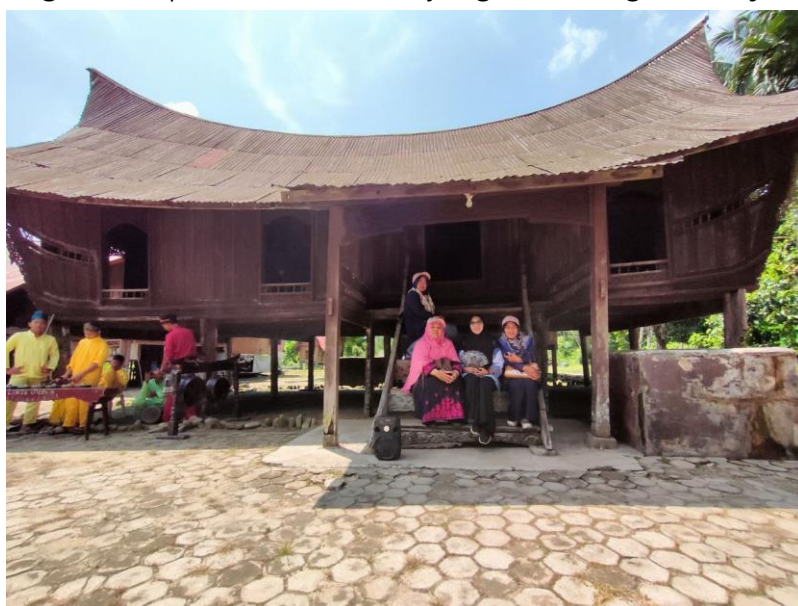
Gambar 2 Rumah Adat Lontiok

Rumah Lontiok, jauh dari hanya menjadi struktur fisik, adalah penjaga nilai-nilai warisan budaya yang hidup. Sebagai simbol identitas lokal, rumah adat ini bukan hanya menyiratkan kekayaan arsitektur, melainkan juga memainkan peran penting dalam merawat dan melanjutkan tradisi lokal. Pelestarian Rumah Lontiok di Kuok menjadi suatu keharusan untuk memastikan bahwa keunikan dan kekayaan budaya Melayu tetap diteruskan di tengah arus perubahan zaman yang terus bergerak maju.