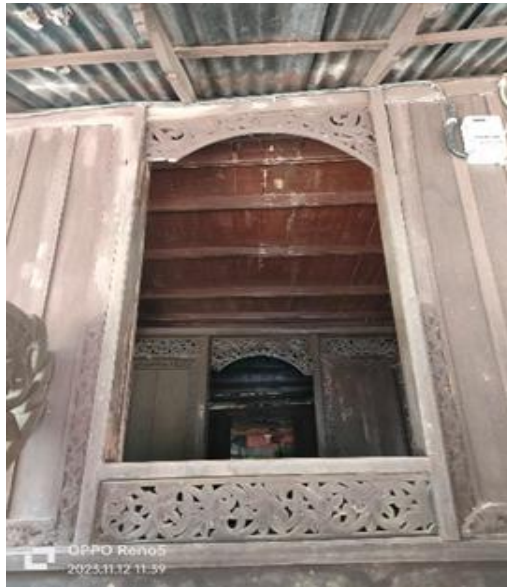
Gambar 6. Pintu Masuk Rumah Lontiok

Pintu masuk Rumah Lontiok dirancang agak memendek dari pintu pada umumnya. Fungsinya direpresentasikan bila ada orang yang akan masuk ke dalam rumah belum boleh masuk secara langsung namun harus berhenti sebentar sebelum masuk ke dalam ruangan.