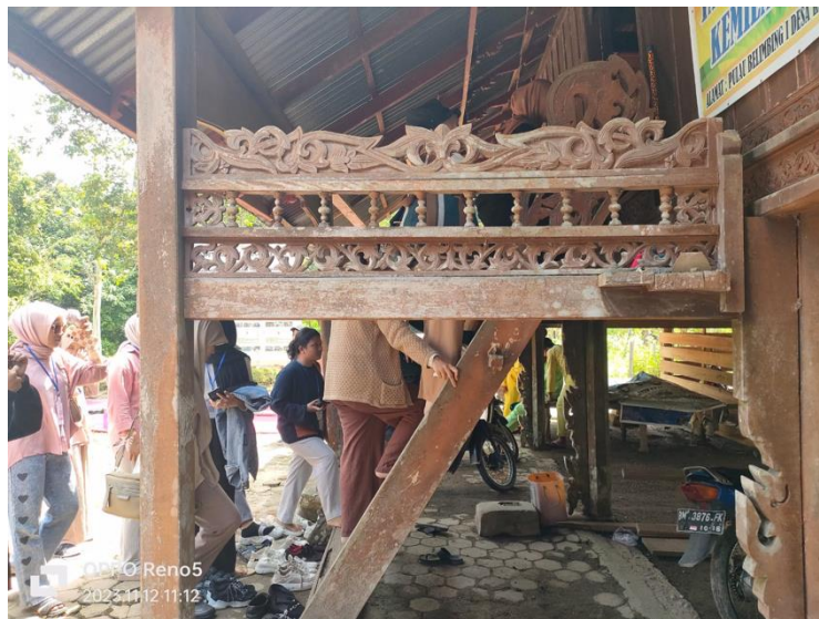
Gambar 3. Ujung Bawah Rumah Lontiok

Salah satu nilai yang dapat ditemui pada tangga ini adalah nilai keberlanjutan. Desain tangga yang telah terbukti berumur panjang dan tetap digunakan oleh masyarakat setempat menegaskan prinsip keberlanjutan dalam membangun struktur yang dapat bertahan seiring waktu. Selain itu, tangga juga mencerminkan kearifan lokal dalam pemanfaatan bahan-bahan alami dan metode konstruksi tradisional yang ramah lingkungan (Irmasolina, 2023). Selanjutnya, tangga rumah lontiok juga mencerminkan nilai-nilai kebersamaan dan solidaritas. Sebagai bagian integral dari rumah, tangga ini tidak hanya berfungsi sebagai jalan fisik, tetapi juga sebagai titik pertemuan antara anggota komunitas. Pada saat-saat tertentu, tangga ini dapat menjadi tempat untuk berkumpul, berbicara, atau merayakan peristiwa bersama, memperkuat rasa kebersamaan dalam masyarakat.