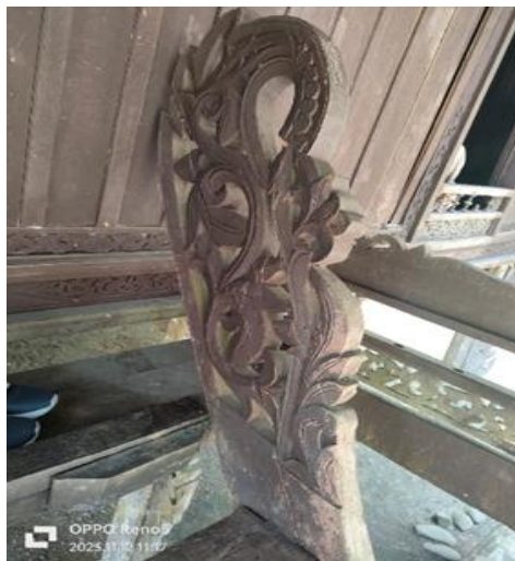
Gambar 7. Ukiran di Papan Anak Tangga

Pintu masuk Rumah Lontiok dirancang agak memendek dari pintu pada umumnya. Fungsinya direpresentasikan bila ada orang yang akan masuk ke dalam rumah belum boleh masuk secara langsung namun harus berhenti sebentar sebelum masuk ke dalam ruangan.