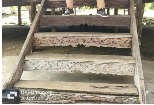
Gambar 4. Anak Tangga Rumah Lontik

Tangga, yang berada di sebelah kanan rumah adat Lontik, mengandung makna bahwa setiap individu akan mengalami perubahan ke arah yang lebih baik dari waktu ke waktu dalam hidupnya. Tangga melambangkan perjalanan menuju tingkat yang lebih tinggi atau menuju perbaikan (Karina, Faizah, Elmustian, & Syafril, 2022). Berikutnya adalah penampungan air atau Kula.