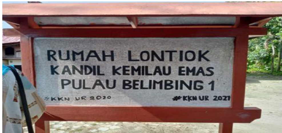
Gambar 1. Papan Nama Rumah Lontiok

bahasa Melayu dengan dialek yang khas, hingga pakaian tradisional yang tetap dijaga dan diteruskan oleh masyarakat setempat (Redovan Jamil, 2023). Di tengah dinamika zaman, Desa Pulau Belimbing tetap menjadi wadah tempat hidupnya tradisi-tradisi ini, menjadikannya seperti museum hidup yang merekam jejak waktu. Rumah Lontiok, sebagai perwujudan arsitektur tradisional di Desa Pulau Belimbing, menyimpan sejarah panjang yang mencerminkan kekayaan budaya Melayu dan pengaruh Islam.