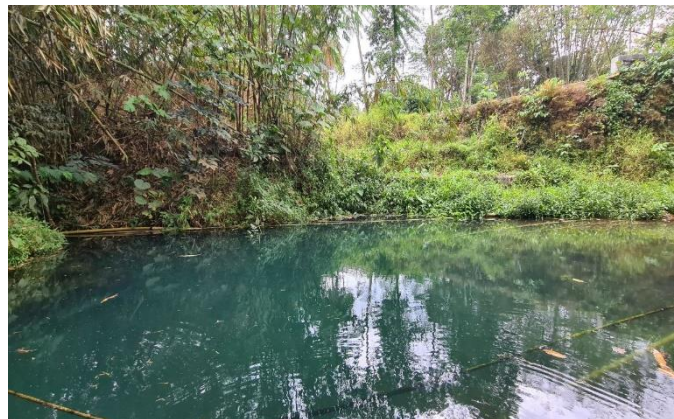
Gambar 3. Lokasi penelitian Sungai Mejing Desa Wisata Nganggring, Sleman