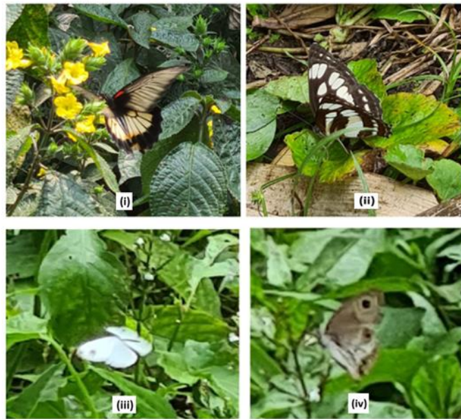
Gambar 2. (i) Papilio memnon , (ii) Neptis hylas , (iii) Pieris brassicae , dan (iv) Mycalesis horsfieldii di ekosistem Sungai Mejing

Kupu-kupu Junonia Atlites (0,5311), Pieris brassicae (0,5311), Hypolimnas bolina (0,6730), dan Catopsilia scylla (0,8274) memiliki indeks keanekaragaman rendah pada lokasi penelitian sebab tumbuhan inang yang tersedia di Sungai Mejing terbatas pada beberapa jenis dan faktor lingkungan lainnya. Kupu-kupu tersebut ditemukan di tepi perairan dan sesekali hinggap di tanaman rumput seperti Cyperus rotundus . Tumbuhan inang ( host plant ) yang dibutuhkan setiap kupu-kupu berbeda tergantung pada jenis kupu-kupu. Tumbuhan inang penting sebagai sumber makanan, tempat hinggap, atau tempat berinteraksi bagi kupu-kupu. Warna, aroma, dan bentuk bunga merupakan sifat penting pada bunga untuk menarik kupu-kupu agar hinggap dan menghisap nektar (Han et al. , 2021).