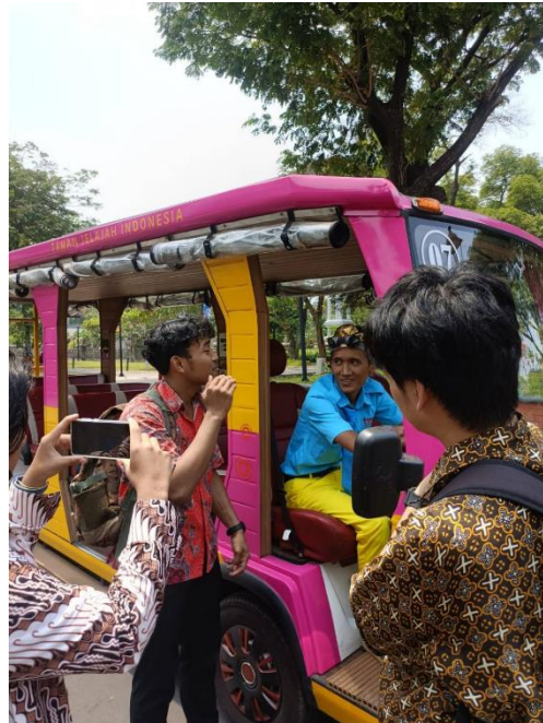
Gambar 4. Pelaksanaan Wawancara dengan Pihak TMII

Kebudayaan adalah hasil cipta karya manusia, seperti ide, perilaku, seni rupa yang disesuaikan dengan lingkungan sekitar, sehingga membudaya di masyarakat. Kebudayaan hinggap di lingkungan bersama, tetapi tidak semua orang harus menanggapi pengertian dari kebudayaan tersebut dalam artian yang sama. Setiap orang memiliki referen nya tersendiri akan kebudayaan ini.