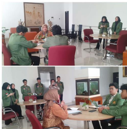
Gambar 3. Pelaksanaan Wawancara dengan Pihak TMII

Pada era globalisasi. Di mana teknologi semakin canggih, kebudayaan yang terdapat di dalam TMII dapat disebarluaskan salah satunya melalui media sosial. Dengan adanya media sosial, hal ini bisa menjadi 'magnet' untuk menarik rasa ketertarikan juga kepenasaranan tentang kebudayaan apa saja yang ada di TMII, seperti museum, anjungan, taman, bangunan, dan sebagainya. Lalu, TMII bisa membuat sebuah event yang dapat dihadiri oleh berbagai masyarakat, baik dalam negeri maupun luar negeri. Dalam event ini, TMII mampu menampilkan tarian-tarian daerah yang ditarikan oleh anak-anak kecil yang sebelumnya telah diajarkan melalui anjungan-anjungan di TMII. Namun, tarian yang ditampilkan tidak hanya tarian tradisional saja, tetapi juga tarian modern yang telah disatupadukan dengan tarian tradisional, sehingga tidak membuat tarian tradisional terlupakan. Hal ini merupakan wujud pelestarian kebudayaan hingga tujuan TMII untuk meneruskan kebudayaan kepada generasi selanjutnya berhasil.