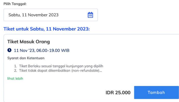
Gambar 6. Tiket Masuk TMII

TMII juga sudah beralih ke tahap digitalisasi, seperti online advertising. TMII dahulu dalam pembelian tiket masih bersifat konvensional, tetapi sekarang TMII sudah mengikuti perkembangan zaman dengan pembelian tiket secara digital. Lalu, TMII juga sudah berhasil menggunakan kecerdasan buatan sebagai media penyebaran informasi. Taman Mini Indonesia Indah (TMII) sedang berusaha untuk memperluas representasi provinsi di area mereka. Awalnya, TMII hanya memiliki 33 provinsi, tetapi mereka berencana untuk menambahkannya menjadi 38. Namun, sebelum melakukan penambahan tersebut, TMII memastikan untuk merencanakan dan mempertimbangkan segala aspek dengan matang terlebih dahulu. Mereka berharap bahwa penambahan provinsi ini akan memberikan pengunjung pengalaman yang lebih lengkap dan otentik tentang keanekaragaman budaya dari sabang sampai merauke.