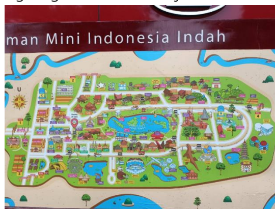
Gambar 1. Peta Taman Mini Indonesia Indah (TMII)

Siti Hartinah Soeharto atau Ibu Tien adalah salah satu pencetus proyek pembuatan miniatur Indonesia yang dinamakan sebagai Taman Mini Indonesia Indah. Sebab Indonesia merupakan negara yang luas, sehingga Ibu Tien memiliki sebuah gagasan untuk membangun miniatur ini. Ibu Tien berniat untuk menjadikan Taman Mini Indonesia Indah (TMII) ini sebagai tempat rekreasi dan tempat pelestarian kebudayaan. Beliau ingin masyarakat Indonesia dapat melihat berbagai pulau, suku, flora, fauna, dan berbagai kebudayaan lainnya yang ada di Indonesia tanpa mendatangi pulau tersebut. Taman Mini Indonesia Indah (TMII) diresmikan pada tanggal 20 April 1975. Taman Mini Indonesia Indah terletak di Jakarta Timur. Bangunan ini memiliki luas sekitar ±100 ha. Untuk luasnya sendiri akan terus berkembang menyesuaikan dengan perkembangan Indonesia. Seiring dengan adanya revitalisasi atau wajah baru untuk menciptakan Taman Mini yang sehat, hijau, emisi nol, bebas polusi, ramah lingkungan, dan berkelanjutan.