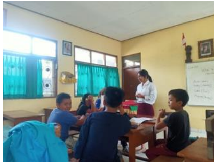
Gambar 8. Pertemuan 5

Pertemuan kelima dilaksanakan pada tanggal 18 November 2023. Pada pertemuan ini, peneliti membahas materi kelima yaitu Future Career dengan topik Flash Card Occupation yang berjumlah 20 buah. Peneliti memulai kegiatan pembelajaran dengan memberikan materi tentang pekerjaan, cara pelapalannya dan cara menyampaikan cita cita yang ingin dicapai dimasa depan. Kegiatan dilanjutkan dengan pembagian Flash Card kepada anak-anak. Anak-anak melafalkan setiap kosakata pekerjaan dalam bahasa Inggris sesuai dengan yang terdapat pada Flash Card . Kegiatan dilanjutkan dengan permainan interaktif dimana peneliti membagi anak-anak menjadi 2 kelompok. Lalu anak-anak secara bergiliran maju ke depan kelas untuk menyampaikan sebuah kata yang mendeskripsikan sebuah pekerjaan sesuai dengan Flash Card yang diberikan oleh peneliti. Anak-anak lainnya harus menebak pekerjaan yang dimaksud oleh anak dalam bahasa Inggris. Kegiatan diakhiri dengan tanya jawab interaktif mengenai kosakata pekerjaan untuk mengetahui tingkat pemahaman anak-anak terkait materi yang dipaparkan.