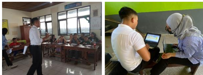
Gambar 3. Proses Observasi Awal (Pemberian Pretest , Wawancara) dan Analisis Hasil Observasi

observasi dan pretest , peneliti mengidentifikasi hasil dari pretest dan wawancara untuk mengetahui permasalahan yang menyebabkan kemampuan penguasaan kosakata anak-anak yang rendah di kawasan Banjar Selat Peken. Ditemukan bahwa, nilai rata-rata hasil tes kosakata bahasa Inggris dasar yang didapat adalah 47,1 yang masuk kedalam kuadran kurang. Hal ini didukung dengan hasil wawancara bersama 7 orang anak-anak yang menyatakan kurangnya intensitas pembelajaran bahasa Inggris di lingkungan sekolah, metode pembelajaran yang membosankan, serta ketidakterersediaan pengajar yang kompeten di lingkungan sekolah menjadi pemicu kurangnya kemampuan penguasaan kosakata mereka. Mereka juga menyampaikan bahwa, wali kelaslah yang menjelaskan materi pembelajaran bahasa Inggris di sekolah. Kadangkala, wali kelas hanya memberikan tugas tanpa menjelaskan materi.