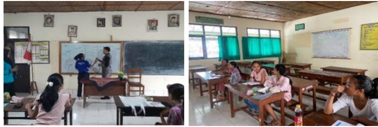
Gambar 6. Pertemuan 3

Pertemuan ketiga dilaksanakan pada tanggal 4 November 2023. Pada pertemuan ini, peneliti membahas materi ketiga yaitu My Favorite dengan topik Flash Card Fruit & Vegetables yang berjumlah 30 buah yang dibagi menjadi 15 Fruit & 15 Vegetable . Peneliti memulai kegiatan pembelajaran dengan memberikan materi buah dan sayuran secara bergantian dan cara pelafalannya. Kegiatan dilanjutkan dengan pembagian Flash Card kepada anak-anak. Anak-anak melafalkan setiap buah dan sayuran dalam bahasa Inggris sesuai dengan yang terdapat pada Flash Card . Kegiatan dilanjutkan dengan permainan interaktif dimana peneliti membagi anak-anak menjadi 2 kelompok. Lalu anak-anak secara bergiliran maju ke depan kelas untuk menggambar sebuah buah atau sayuran yang ada pada kartu Flash Card yang diberikan oleh peneliti lalu menginstruksikan teman-temannya untuk menebak gambar yang digambar di depan. Kegiatan diakhiri dengan pelaksanaan tes tanya jawab untuk mengetahui pemahaman anak-anak terkait materi yang dipaparkan.