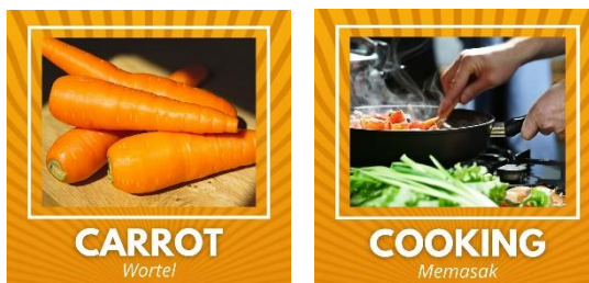
Gambar 1. Media Flash Card yang akan diterapkan

Langkah keempat adalah pengimplementasian produk Flash Card pada kegiatan English Course yang dilaksanakan sebanyak 6 kali selama 1 jam 30 menit disetiap kali pertemuan. Pembelajaran dibagi menjadi beberapa sesi diantaranya: 1) Tahap pembahasan materi, 2) Tahap pemberian latihan yang dikombinasikan dengan metode permainan interaktif, dan 3) Pengadaan tanya jawab disetiap akhir pertemuan untuk mengetahui pemahaman siswa melalui tanya jawab singkat. Tahapan kelima adalah monitoring dan observasi pengimplementasian produk dalam kegiatan pembelajaran English Course . Peneliti mengobservasi sejauh mana efektifitas penggunaan Flash Card dalam peningkatan kemampuan kosakata bahasa Inggris melalui hasil wawancara, pretest dan posttest . Pelaksanaan wawancara dilaksanakan sebanyak 2 kali dalam proses pembelajaran yaitu di awal untuk mengetahui permasalahan yang muncul dan diakhir proses pembelajaran (saat