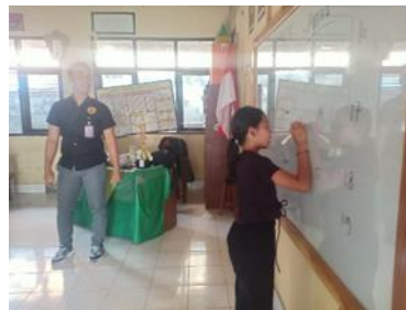
Gambar 5. Pertemuan 2

Pertemuan kedua dilaksanakan pada tanggal 28 Oktober 2023. Pada pertemuan ini, peneliti membahas materi kedua yaitu Numbers dengan topik Flash Card Numbers yang berjumlah 29 buah yang dibagi 20 angka dari 1 sampai 20 dan 10 angka puluhan seperti 30 ( thirty ), 40 ( forty ) dan seterusnya. Peneliti memulai kegiatan pembelajaran dengan memberikan materi angka, cara pelapalannya dan rumus agar lebih mudah dalam mengingat angka dalam bahasa Inggris. Kegiatan dilanjutkan dengan pembagian Flash Card kepada anak-anak. Anak-anak melafalkan setiap angka dalam bahasa Inggris sesuai dengan yang terdapat pada Flash Card . Kegiatan dilanjutkan dengan permainan interaktif dimana peneliti membagi anak-anak menjadi 2 kelompok. Lalu anak-anak secara bergiliran