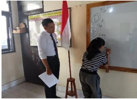
Gambar 4. Pertemuan 1

Pertemuan pertama dilaksanakan pada tanggal 21 Oktober 2023. Pada pertemuan ini, peneliti mengenalkan Flash Card kepada anak-anak sekaligus membahas materi pertama yaitu spelling dengan topik Flash Card Alphabet yang berjumlah 26 buah. Peneliti memulai kegiatan pembelajaran dengan memberikan materi huruf dan cara pelapalannya lalu dilanjutkan dengan pembagian Flash Card kepada anak-anak. Anak-anak melafalkan setiap huruf bahasa Inggris sesuai dengan yang terdapat pada Flash Card . Kegiatan dilanjutkan dengan permainan interaktif dimana peneliti membagi anak-anak menjadi 2 kelompok. Lalu anak-anak secara bergiliran maju ke depan kelas dan menulis sebuah kata dalam bahasa Inggris dari awalan huruf yang telah diajarkan dalam bentuk kata rumpang yang harus ditebak oleh teman-temannya. Lalu, anak yang bisa melengkapi huruf yang rumpang menjadi kata yang utuh harus melafalkan kata tersebut dalam bahasa Inggris.