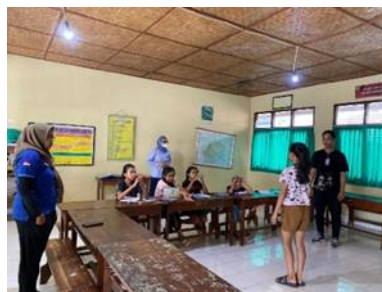
Gambar 7. Pertemuan 4

Pertemuan keempat dilaksanakan pada tanggal 11 Oktober 2023. Pada pertemuan ini, peneliti membahas materi keempat yaitu My Hobby dengan topik Flash Card Hobby yang berjumlah 15 buah. Peneliti memulai kegiatan pembelajaran dengan memberikan materi kosakata tentang hobi, cara pelafalannya, dan cara untuk menyatakan hobi dalam bahasa Inggris. Kegiatan dilanjutkan dengan pembagian Flash Card kepada anak-anak. Anak-anak