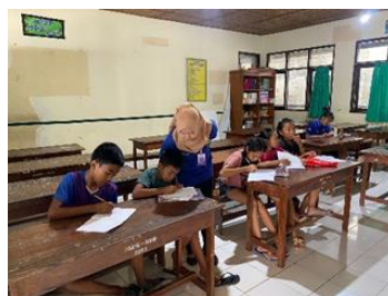
Gambar 9. Pertemuan 6