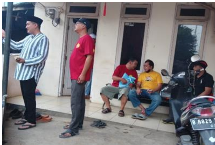
Gambar 2 Suasana Kehidupan Masyarakat di Sekitar Masjid Tjia Kang Hoo

Mayoritas masyarakat di sekitar Masjid Tjia Kang Hoo adalah nonmuslim, sementara masyarakat Muslim menjadi minoritas di wilayah tersebut. Populasi masyarakat pendatang dan pengontrak di sekitar Masjid Tjia Kang Hoo berjumlah 131 keluarga, di antaranya terdapat keluarga Tionghoa yang berjumlah sekitar 85%. Kemudian, dari 85% nonmuslim Tionghoa tersebut, terbagi menjadi 50% beragama Konghucu, 30% beragama Muslim, dan 20% lainnya beragama Kristen dan Buddha. Gambar 2 menunjukkan suasana kehidupan masyarakat di sekitar Masjid Tjia Kang Hoo.