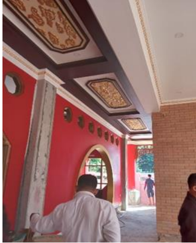
Gambar 1 Suasana Pembangunan Masjid Tjia Kang Hoo

suasana pembangunan Masjid Tjia Kang Hoo.