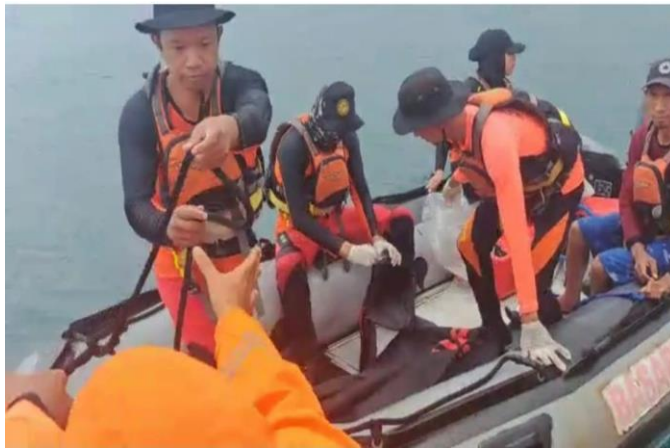
Gambar 5.2 Keluarga Ikut Mencari Korban

Berdasarkan hasil wawancara dan observasi yang dilakukan di lapangan juga dapat dilihat dalam melakukan pencarian orang yang tenggelam komunikasi tidak hanya dilakukan dengan sesama Tim SAR tetapi komunikasi akan terus dilakukan dengan pihak keluarga, dalam hal ini koordinasi yang dilakukan pihak keluarga untuk ikut langsung melakukan pencarian dan hasil dari koordinasi kepala Kantor Basarnas Bengkulu mengizinkan pihak keluarga akan diikuti sertakan dalam pencarian. Selain itu setelah korban ditemukan pihak Basarnas akan menyerahkan korban kepada keluarga korban dan terus melakukan komunikasi dengan keluarga korban.