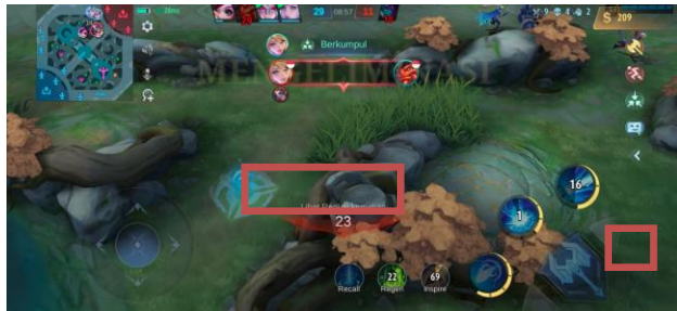
Gambar 4. Menggunakan Quick Chat "berkumpul"