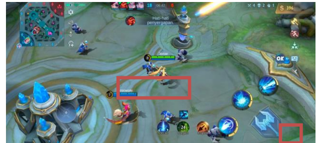
Gambar 5. Menggunakan Quick Chat Kumpulan pesan lainnya yakni "hati-hati penyergapan"

Dilansir dari revivaltv.id , Tanujaya (2023) mengemukakan bahwa fitur quick chat Mobile Legends diperbarui sejak masuknya season 28 . Season dalam Mobile Legends diartikan sebagai musim, dan dalam 1 tahun biasanya dibagi menjadi 4 musim. Musim 28 Mobile Legends dimulai sejak 25 Maret 2023. Saat itu pula fitur OK ditambahkan pada fitur quick chat Mobile Legends. Hingga tulisan ini mulai dibuat pada Oktober 2023, fitur OK ini masih terdapat dalam Mobile Legends. Fitur ini memberi kemudahan bagi para pemain sebagai penerima pesan dalam memberikan tanggapan kepada teman satu tim yang mengirimkan pesan cepat. Hadirnya fitur OK ini membuat pemain tidak perlu mengetik balasan secara manual. Cukup memilih OK, maka pengirim pesan cepat dapat mengetahui tanggapan teman satu timnya.