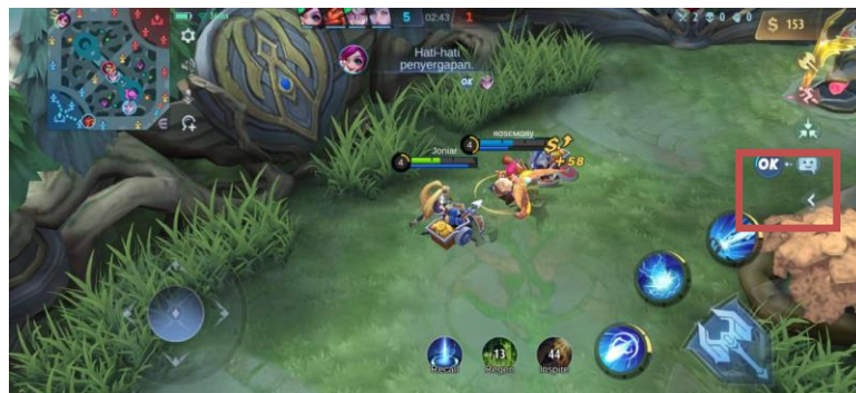
Gambar 1. Tampilan Fitur Quick Chat . OK Saat Teman Satu Tim Mengirim Pesan Cepat

yang memungkinkan pemain berkomunikasi dengan teks pesan yang diketik pada kolom chat . Fitur ini terkesan sulit digunakan saat di tengah pertempuran, karena memakan waktu dalam mengetik pesan. Sejalan dengan hasil penelitian Ananda, dkk (2022) yang mengemukakan bahwa fitur komunikasi yang cenderung jarang digunakan oleh tim ialah chat box karena terlambat dalam penyampaian pesan serta tampilan chat yang muncul mengganggu konsentrasi pemain. Kekurangan fitur chat box tersebut kemudian memunculkan budaya komunikasi baru di kalangan pecinta game Mobile Legends ini. Budaya baru tersebut berupa penciptaan ragam bahasa, kode, atau singkatan istilah dengan tujuan mempersingkat waktu mengetik saat menggunakan fitur chat box di tengah pertempuran (Ananda, dkk, 2022). (3) quick chat , fitur yang memungkinkan pemain berkomunikasi dengan mengirimkan pesan instan atau pesan cepat yang sudah disusun oleh tim pengembang aplikasi. Dalam menggunakan fitur ini, pemain dapat memilih pesan cepat yang dibutuhkan. Setelah memilih, maka secara otomatis akan terkirim ke seluruh anggota dalam tim, dan saat itu pula akan muncul tulisan OK pada layar anggota tim penerima pesan cepat tersebut.