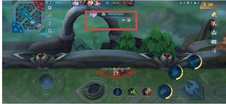
Gambar 6. Tampilan Saat Pemain Menggunakan Fitur OK dalam Menanggapi Kiriman Pesan Quick Chat dari Teman Satu Tim

Penulis mencatat frekuensi pemain Mobile Legends menggunakan fitur OK ini mulai tanggal 20 September hingga 20 Oktober 2023 atau selama 31 hari dengan cara berpartisipasi secara langsung memainkan Mobile Legends. Penulis memainkan game ini sebanyak 3 kali dalam sehari. Sehingga, total pertandingan yang dilakukan penulis ialah 93 kali. Dari 93 kali pertandingan tersebut, tidak ada 1 pertandingan pun yang pemainnya tidak menggunakan fitur quick chat . Artinya bahwa setiap pertandingan, pemain selalu mengirimkan pesan cepat, baik itu menggunakan "serang", "mundur", "berkumpul", maupun menggunakan kumpulan pesan cepat lainnya.