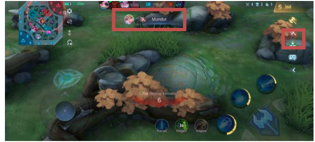
Gambar 3. Menggunakan Quick Chat "mundur"