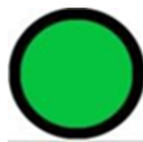
Gambar 1. Obat Bebas

Obat bebas, yaitu obat yang boleh digunakan tanpa resep dokter, atau disebut juga sebagai obat Over The Counter (OTC), yang terdiri dari obat bebas dan obat bebas terbatas. Obat Bebas (OB), lingkaran berwarna hijau dengan garis tepi berwarna hitam.