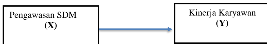
Gambar 1 Desain Penelitian

Desain penelitian dapat dijelaskan melalui gambar di bawah ini, pengawasan sumber daya manusia sebagai variable X ( independent variables ), dan kinerja karyawan sebagai variable Y ( dependent variables ).