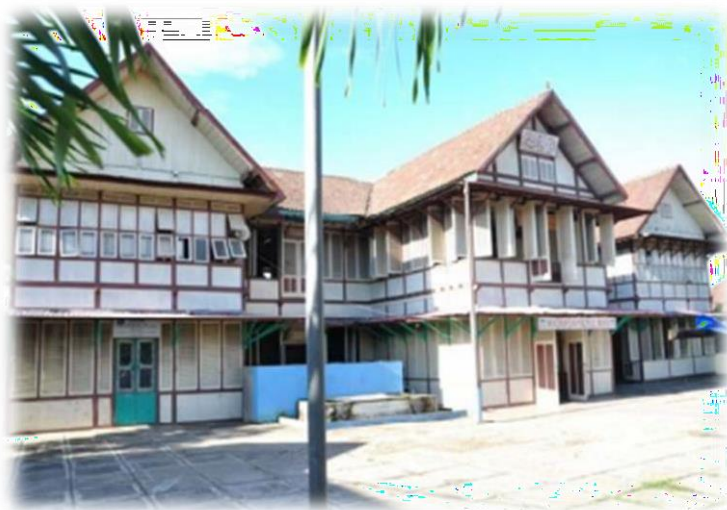
Pesantren Nurul Iman

Pesantren Nurul Iman merupakan pesantren tertua di Kota Jambi. Pesantren ini didirikan sekitar tahun 1915 M. Pesantren ini dibangun oleh Haji Hasan Aman. Madrasah Nurul Iman, terletak di Jl. KH. Qodir Ibrahim, Kel. Ulu Gedong, Kecamatan Danau Teluk, Kota Jambi. Madrasah ini memiliki luas tanah 2.935 m 2 dengan luas bangunan 1400 m 2 . Terdiri dari 2 lantai dengan arsitektur perpaduan perpaduan gaya indis ( Eropa) dengan rumah panggung tradisional. Konstruksi utama dari kayu Unsur indis terlihat padaatap berbentuk pelana dengan tingkat kemiringan yang tinggi, jendela dan pintu berukuran besar, serta ventilasi berjajar yang berfungsi untuk sirkulasi udara. Sementara elemen lokal terlihat pada bentuk bangunan panggung dengan dinding dihiasi sulur-suluran.