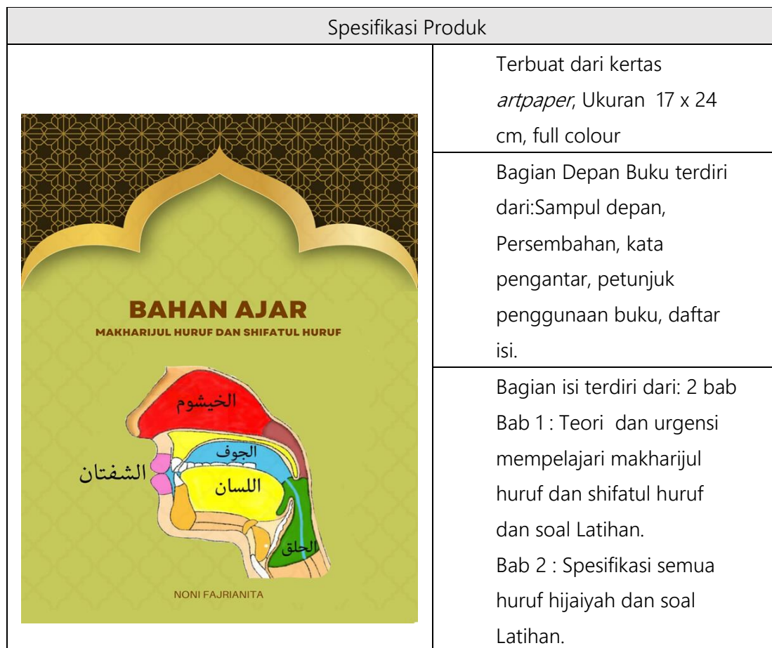
Tabel 1 Spesifikasi Produk Pengembangan Bahan Ajar

Tahap selanjutnya penyusunan outline yang berisi rancangan secara mendetail bahan ajar makharijul huruf dan shifatul huruf berbasis gambar yang akan dikembangkan. Bahan ajar yang akan dikembangkan dalam penelitian ini dibuat berbentuk buku pelajaran. Berdasarkan hasil analisis, penambahan materi pembelajaran disertai gambar untuk mempermudah pemahaman teori yang dibuat menarik dapat menambah motivasi belajar anak. Anak dan guru sangat tertarik belajar dengan menggunakan bahan ajar makharijul huruf dan shifatul huruf , maka Peneliti mengembangkan bahan ajar dengan kertas yang tebal agar buku bisa digunakan dalam waktu yang lama. Membuat bahan ajar bergambar yang menarik sehingga anak tidak jenuh dalam pembelajaran tersebut.