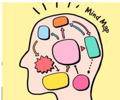
Gambar 1. Contoh Konsep Mind Mapping

Pentingnya literasi bukan hanya melihat kemampuan siswa; itu juga mempengaruhi pandangan mereka tentang literasi dan mendorong mereka untuk berpartisipasi aktif dalam kegiatan literasi. (USAID, 2014). Metode Mind Mapping dalam pembelajaran lebih mengedepankan keterlibatan dan kreasi aktif siswa sekolah dasar, sehingga mampu meningkatkan kemampuan mengingat dan memahami konsep dengan lebih baik, serta merangsang kreativitas mereka. Tidak hanya akan membuat kegiatan belajar mengajar menjadi lebih menarik, tetapi juga akan membuat siswa menjadi lebih bersemangat dalam belajar dan menghadapi tugas, gigih dalam mengatasi kesulitan, senang dalam mencari dan menyelesaikan berbagai masalah, mampu bekerja secara mandiri, serta dapat mempertahankan jawabannya.