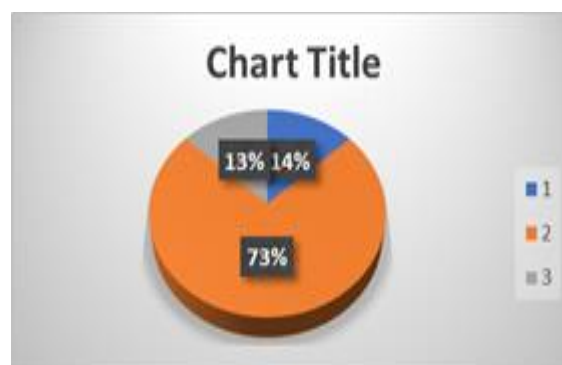
Gambar 1. Persentase Tingkat Self Confidence Siswa

Dari tabel diatas dijelaskan bahwa siswa kelas VII SMP Gajah Mada yang berjumlah 30 siswa, 4 siswa memiliki tingkat self confidence tinggi atau 14%, 22 siswa memiliki self confidence sedang atau 73%, 4 siswa memiliki self confidence rendah atau 13 % untuk perhitungan dapat dilihat