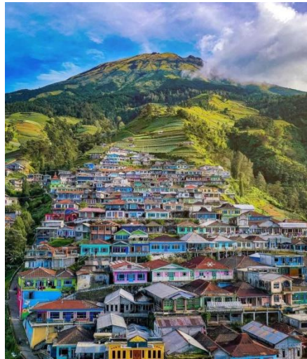
Gambar 2. Nepal Van Java