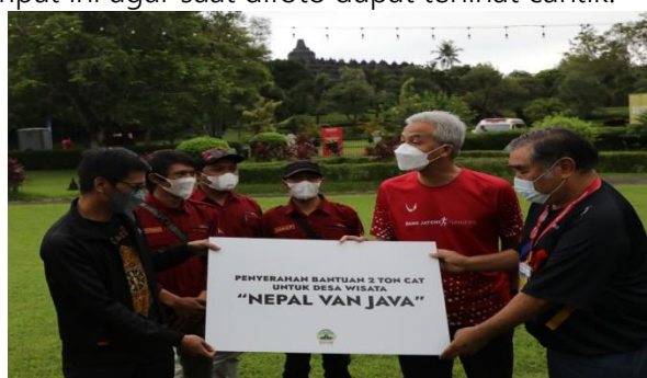
Gambar 3. Penyerahan Bantuan 2 Ton Cat Untuk Desa Wisata Nepal Van Java

Selain peran dari Menteri Pariwisata dan Ekonomi Kreatif, ada juga peran dari bapak Ganjar Pranowo selaku Gubernur Jawa Tengah. Beberapa kali beliau bersepeda ke dusun tersebut dan memberikan dua ton cat untuk memperindah Nepal Van Java. Bagi warga sekitar bantuan tersebut sangat membantu bagi warga sekitar. Beliau mengatakan bantuan cat ini bisa digunakan untuk mempercantik tempat ini agar saat difoto dapat terlihat cantik.