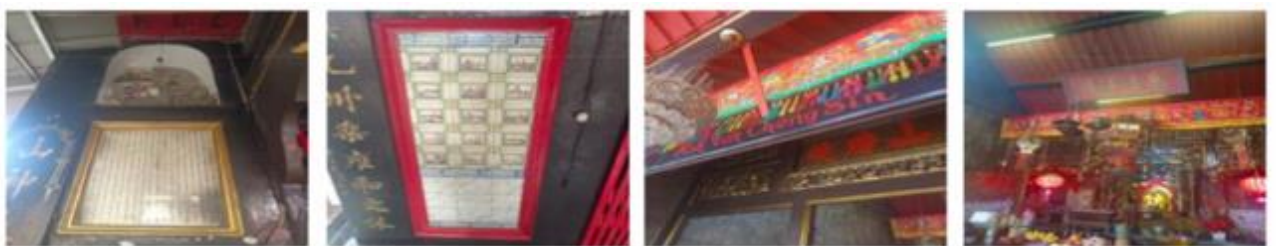
Gambar 9. Catatan Sejarah Terbentuknya Klenteng Jamblang dan Informasi Terbentuknya Komunitas Cina.

Barang-barang yang ada pada ruangan utama banyak berasal dari sumbangsih masyarakat umum yang diberikan kepada klenteng ini sebagai tanda ucapan terima kasih. Oleh karenanya kleteng ini juga memiliki nilai publik karena menerima barang-barang tertentu dari masyarakat umum untuk dapat dipajang pada interior ruangan klenteng sesuai persetujuan pengurus klentengJamblang ini.