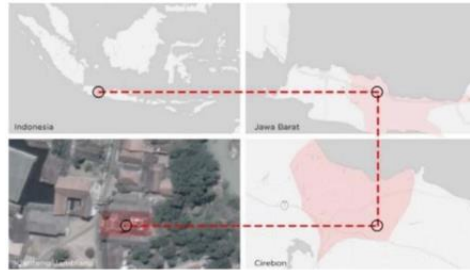
Gambar 1. Peta Lokasi Klenteng Jamblang

ruas jalan raya Cirebon-Bandung dan di lewati oleh Sungai Jamblang yang mengalir dari arah selatan ke utara. Sungai Jamblang tergolong sungai yang besar dan sangat terkenal dengan komunitas Tionghoanya.