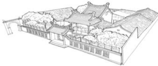
Gambar 3. Sketsa Vihara Dharma Rakita