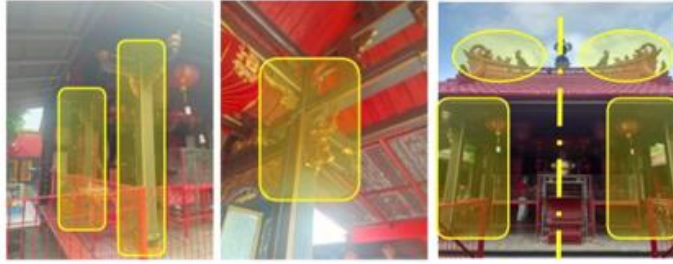
Gambar 4. Tiang Dan Struktur Penopang Atap Vihara Dewi Welas Asih.