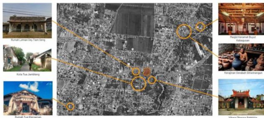
Gambar 11. Foto Bangunan Sekitar Kawasan dan Map Klenteng Jamblang

Bangunan klenteng ini tidaklah berdiri sendiri ini terbukti dengan beberapa bangunan yang masih berdiri di kawasan tersebut yang bergaya kolonial dipadupadankan dengan gaya bangunan pecinan, Bukti yang cukup mewakili keberadaan pemukiman Tionghoa kuno adalah bangunan Klenteng Hok Tek Ceng Sin atau dikenal dengan sebutan Klenteng Jamblang atau Vihara Dharma Rakhita. Dalam perjalanannya, pemukiman Tionghoa ini berkembang pesat dengan aktivitas perdagangan di tepian sungai Jamblang. Sehingga relasi hubungan dengan sekitarnya sangat erat sekali .