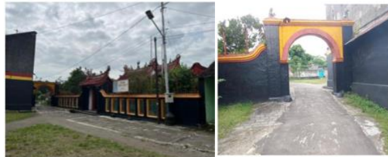
Gambar 2 . Gerbang Klenteng Jamblang

pemugaran dan peristiwa kesejarahan yang pernah terjadi di wilayah Jamblang. Beberapa informasi tersebut diantaranya tentang kerusakan, bencana alam, kebakaran, wabah penyakit, dan pengangkatan kepala kampung atau wijkmeester serta perkiraan penduduk Jamblang di tahun 1806 yang berkisar hanya beberapa ratus orang laki-laki dan perempuan. Peristiwa-peristiwa tersebut terekam dengan baik berdasarkan tahun kejadian. Kejadian yang tertulis tidak setiap tahun, tetapi hanya beberapa tahun yang dianggap penting.