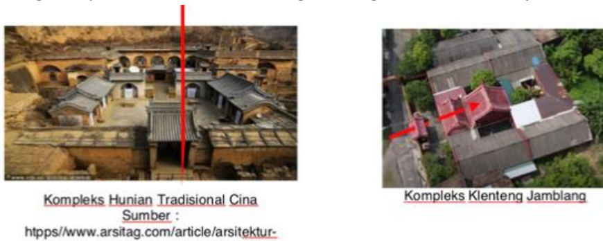
Gambar 8. Kompleks Hunian Tradisional Cina dan Kompleks Klenteng Jamblang Nilai sejarah dan publik

Nilai budaya dan nilai edukasi dari klenteng Jamblang didapat dari bagaimana bentuk arsitektur tradisional Cina dipakai untuk membuat suatu bangunan dan perletakan ruangan sangat diperhatikan sesuai dengan fungsi dan hierarkinya.