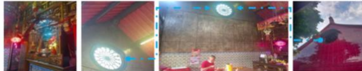
Gambar 5. Pencahayaan Kleneng Dharm Rakit

Pencahayaan alami ke dalam ruangan berasal dari jendela yang berbentuk bulan dengan pola menyerupai bunga. Pada bagian luar digunakan keramik untuk selubung penutup dinding bangunan. Pada struktur utama atap digunakan kayu jati dengan dimensi sekitar 25 cm x 25 cm yang di kedua sisi ujung-ujungnya terdapat bentuk kepala naga terbuat dari material besi. Fungsi pencahayaan, pengkondisian udara tertata baik di kleneng Jamblang ini yang merupakan adaptasi dari lingkungan sekitar dimana bangunan ini berada. Penggunaan keramik untuk ornament pada dinding sebagai ciri khas arsitektur tradisional Cina tampak terlihat pada dinding bagian bawah di ruangan utama yang bergambar tentang perjalanan masyarakat Cina sampai ke Indonesia.