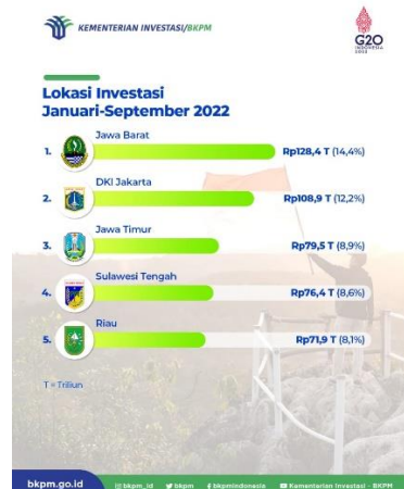
Sumber 2 kominfo.go.id

Pada gambar peta wilayah ciayumajungkuning menunjukkan letak geografis Ciayumajakuning terletak pada koordinat geografis sekitar 6°39'39" Lintang Selatan hingga