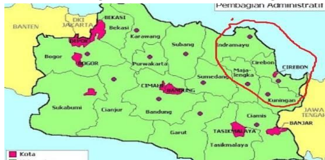
Gambar 2. 1 peta ciayumajungkuning

Data masyarakat yang menunjukkan minat yang meningkat terhadap Danareksa. Hal ini didukung dengan meningkatnya grafik pertumbuhan jumlah investor Danareksa. Grafik ini memperlihatkan tren positif yang menggambarkan peningkatan minat masyarakat dalam berinvestasi melalui produk-produk Danareksa. Jumlah investor pasar modal di tahun 2018 sejumlah 1.619.372 dan hal ini meningkat di tahun 2021 sejumlah 5.822.870 masyarakat. Jumlah investor C-BEST di tahun 2018 hanya 852.240 sedangkan di tahun 2021 meningkat menjadi 2.589.880. jumlah investor reksa dana di tahun 2018 hanya 999.510 sedangkan di tahun 2021 meningkat menjadi 5.165.798 masyarakat. Jumlah investor surat berharga negara di tahun 2018 hanya 195.277 sedangkan di tahun 2021 meningkat menjadi 544.891.