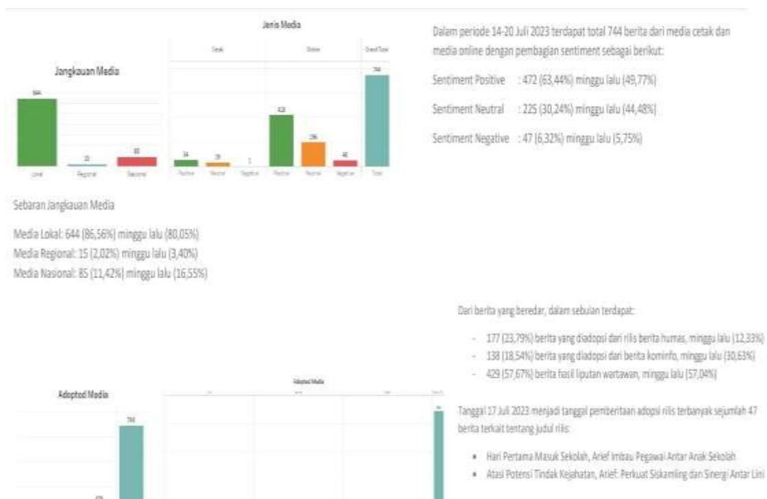
Gambar 2. Media Monitoring Prokomp Kota Tangerang

Prokomp mengatur kegiatan press briefing kepada media mengenai kegiatan yang akan dan telah dilakukan pemerintah.