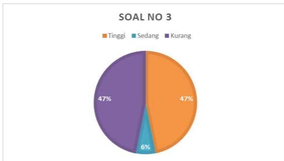
Gambar diagram Soal Nomor 3/ Indikator 3

kreatif siswa untuk yang Kurang Kreatif terdiri dari 2 siswa dengan persentase 6%, kategori kreatif sedang terdiri dari 16 siswa dengan persentase 50%, dan kategori kreatif tinggi terdiri dari 12 siswa dengan persentase 44%. Soal nomor 2 ini menunjukkan bahwa siswa berada pada kategori kurang kreatif, sedang dan tinggi.