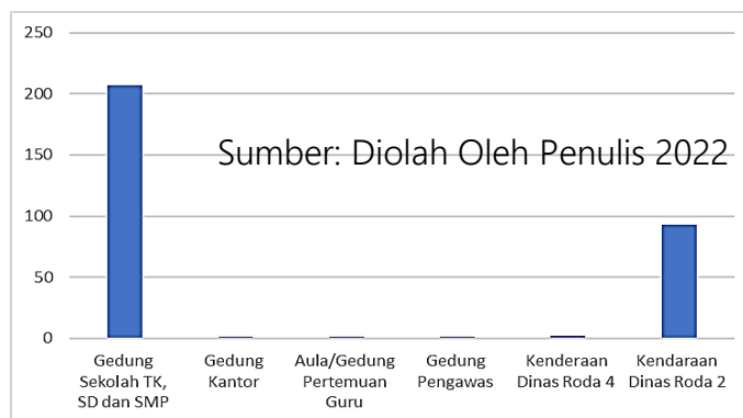
Gambar 2. Sarana dan Prasarana Dinas Pendidikan Kabupaten Aceh Tengah

Dinas Pendidikan Kabupaten Aceh Tengah merupakan lembaga pendidikan yang menaungi seluruh tingkatan pendidikan tingkat kabupaten yang terdiri dari TK, SD, dan SMP. Dalam pengajuan program pengadaan sarana dan prasarana sekolah dibutuhkan database yang bertujuan untuk sebagai alat kelengkapan sumber informasi bagi Dinas Pendidikan