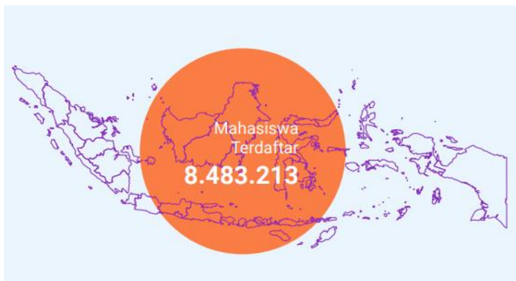
Gambar 2. Sebaran Mahasiswa di Indonesia