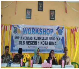
Gambar 1. Foto workshop IKM

Pada tahun 2023 ini, tepatnya bulan Agustus, pihak Sekolah Luar Biasa Negeri (SLBN) 1 Kota Bima telah memantapkan diri untuk mulai memberlakukan kurikulum merdeka. Sebelumnya peneliti sempat melakukan pengamatan pendahuluan tentang isu kurikulum merdeka dan persiapan sekolah khususnya para guru dalam pelaksanaannya. Kurangnya sosialisasi dan pelatihan secara kolektif untuk (SLBN) 1 Kota Bima menjadi salah satu hambatan yang dirasakan oleh pihak sekolah dalam mengimplementasikan kurikulum merdeka. Maka dari itu Pada tanggal 5 Agustus 2023 Pihak sekolah secara mandiri mengadakan workshop yang bertemakan “Implementasi Kurikulum Merdeka” dengan mengundang pemateri yang sesuai dengan tujuan workshop. Berikut ungkapan dari wakil kepala sekolah dan foto di sosial media.