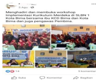
Gambar 2. KumpulanFoto workshop IKM