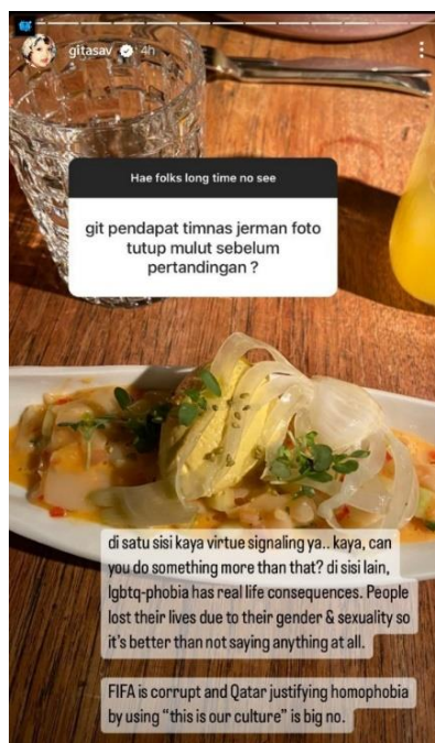
Gambar 2. Gitasav saat ditanyakan pendapatnya mengenai aksi diam Timnas Jerman

Perbedaan pandangan antara Gitasav dan masyarakat Indonesia mencerminkan perbedaan dalam nilai, keyakinan, dan norma yang ada di masyarakat. Gitasav, yang telah tinggal di Jerman selama beberapa waktu, memiliki pandangan yang lebih terbuka dan liberal, sementara masyarakat Indonesia masih lebih konservatif dalam hal ini. Perbedaan ini menghasilkan berbagai reaksi negatif dari netizen di media sosial. Namun demikian, fenomena "Cancel Culture" yang terjadi pada Gitasav juga dapat dipandang sebagai bentuk intoleransi dan keengganan untuk menerima pandangan yang berbeda. Dalam penelitian ini, fenomena Cancel Culture yang dialami oleh Gitasav dijelaskan sebagai sebuah upaya untuk menghukum dan mengasingkan seseorang karena perbedaan pandangan atau tindakan mereka yang dianggap tidak sesuai dengan norma sosial atau moral yang berlaku. Meskipun Gitasav menghadapi banyak kritik dari netizen, ia tetap mempertahankan pemikirannya yang terbuka dan kritis, yang menunjukkan bahwa ia memiliki keberanian untuk mempertahankan pendapatnya. Dalam penelitian ini diharapkan dapat menunjukkan bahwa fenomena Cancel Culture masih menjadi masalah di masyarakat Indonesia, terutama dalam konteks perbedaan pemikiran dan pandangan. Namun, dengan mempertahankan pendapatnya yang terbuka dan kritis, Gitasav memberikan contoh keberanian untuk menghadapi kritik dan mempertahankan integritasnya sebagai seorang penulis dan influencer.