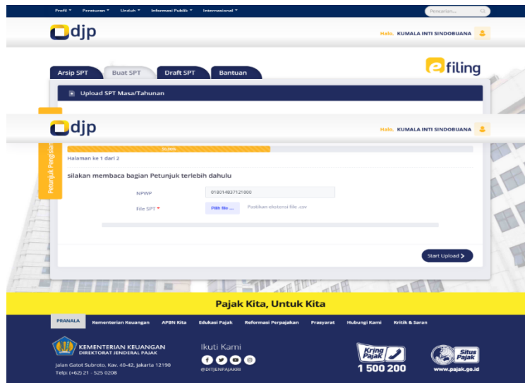
Gambar 2. Pelaporan SPT PPh Pasal 21 Pegawai Tetap memakai DJP Online PT.Kumala Inti Sindobuana SPBU 142011102