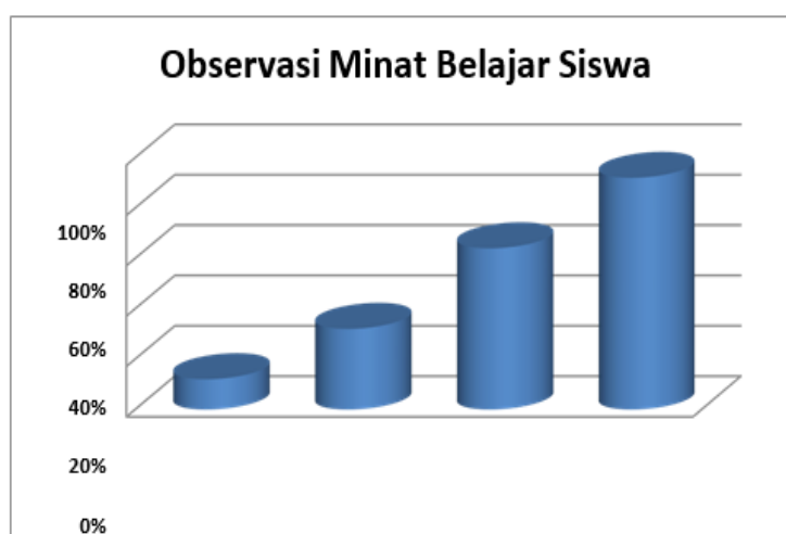
Gambar 4. Diagram Perubahan Minat Belajar Siklus I dan Siklus II

Untuk lebih jelasnya peningkatan skor rata-rata minat belajar siswa secara klasikal pada II siklus dapat dilihat pada diagram batang berikut ini.