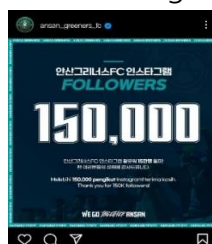
Gambar 3.4. Screenshot Postingan 150 Ribu Followers