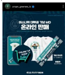
Gambar 3.3. Asnawi Special Merchandise Online Shop Sales