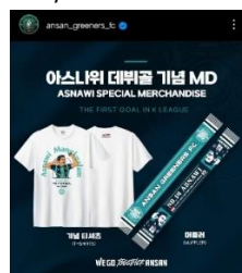
Gambar 3.2. Asnawi Special Merchandise First Launch