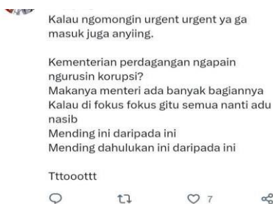
( Gambar 1.3 )

Gambar tersebut terlihat bahwa topik pembahasan yang ada bukan hanya mengenai percintaan ataupun selebritis saja, melainkan hal - hal yang sedang di perbincangkan pada saat itu. Masyarakat pun ikut meramaikan hal - hal yang di posting oleh akun base tersebut. Berbagai sudut pandang mulai bermunculan, yang membuat masyarakat semakin berpikir bahwa ada banyak cara pandang yang berbeda. Ketika kita melihat banyak cara pandang, maka akan membuka pikiran kita untuk melihat dari pandangan orang lain juga.