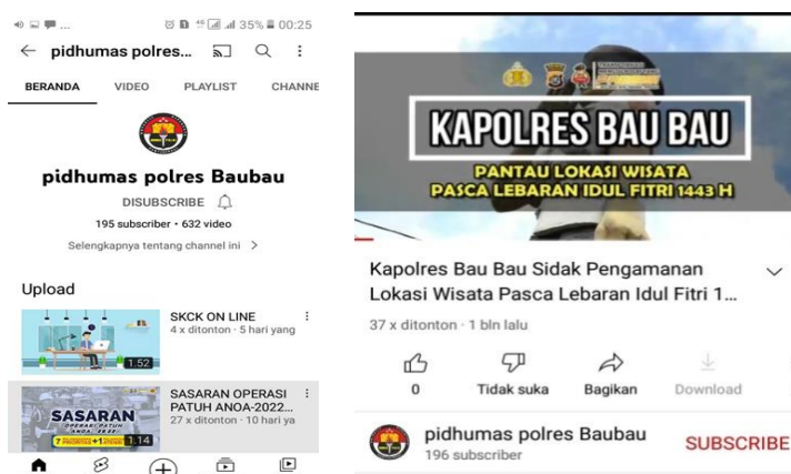
Gambar 2 Channel YouTube Humas Polres Kota Baubau